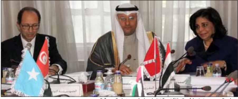
د.علي العبيدي مترئسا أعمال المكتب التنفيذي لمجلس وزراء الصحة العرب

الدورة السابقة لمجلس وزراء الصحة العرب ومشاريع القرارات التي أعدها المكتب لرفعها للدورة الـ 43 أعمال الدورة الـ 43 لمجلس وزراء الصحة العرب عقدها غدا بمقر الجامعة العربية برئاسة المغرب. ويشارك في اجتماع المكتب التنفيذي ووزراء الصحة في مصر وقطر وممثلو وزراء الصحة في فلسطين وسلطنة عمان وتونس وليبيا والمغرب والصومال وبحضور الأمين العام المساعد بالجامعة العربية بدر العاللي. على صعيد متصل، عقد مجلس إدارة الصندوق العربي للتنمية الصحية اجتماعا بالأمانة العامة للجامعة العربية على هامش اجتماع المكتب التنفيذي لمناقشة أوضاع الصندوق وموازنته والمشاريع التي تقوم بتنفيذها في عدد من الدول العربية. وجرى خلال اجتماع مجلس الإدارة اعتماد الميزانية التقديرية السنوية للصندوق لعام 2015 بقيمة مليون دولار.