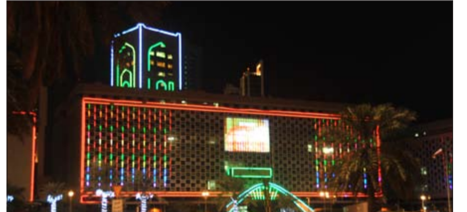
.. ومبنى البلدية