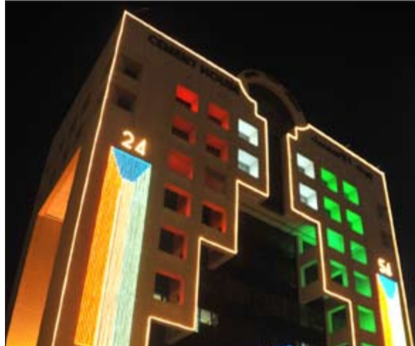
أحد المباني في كامل حلتها