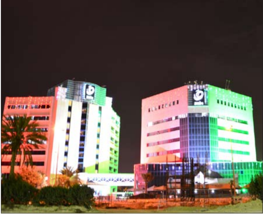
مبنى شركة زين