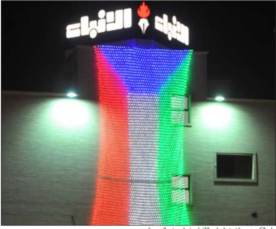
علم الكويت يحتضن شعار «الانباء» فوق مبنى الجريدة