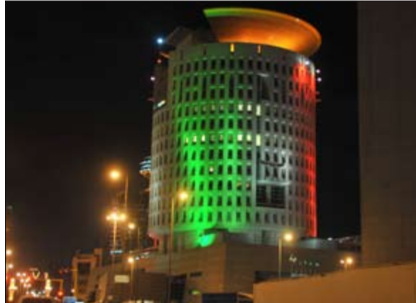
غرفة التجارة والصناعة تزينت بالوان علم الكويت