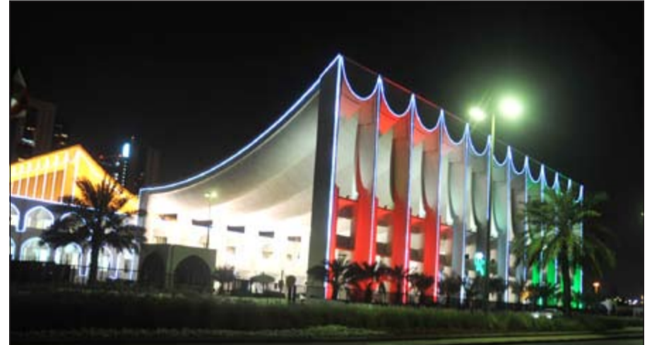
مبنى مجلس الأمة