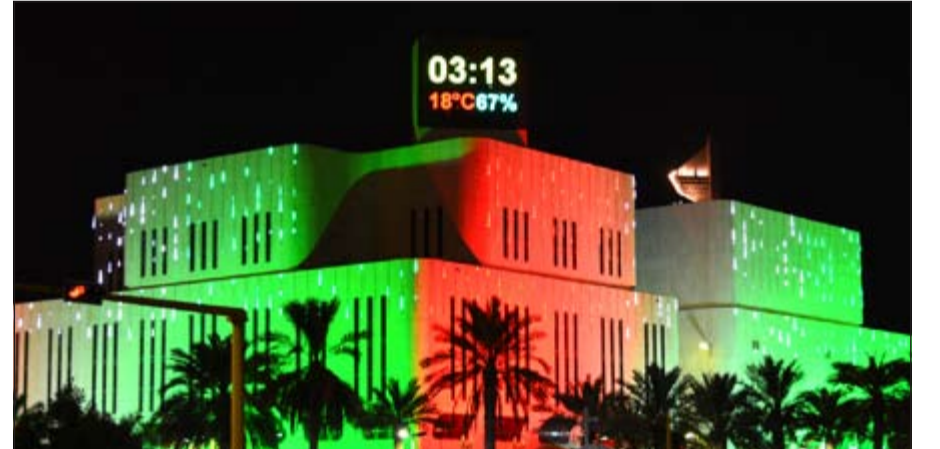
الوان علم الكويت على أحد المباني التابعة لوزارة الكهرباء