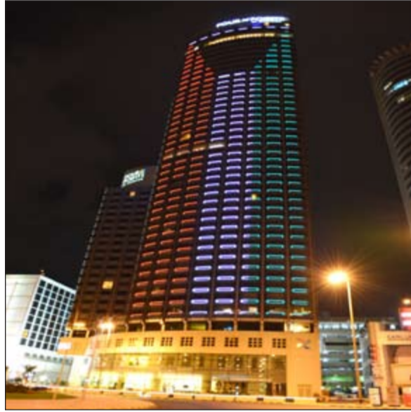
.. ومبنى «الشيراتون»