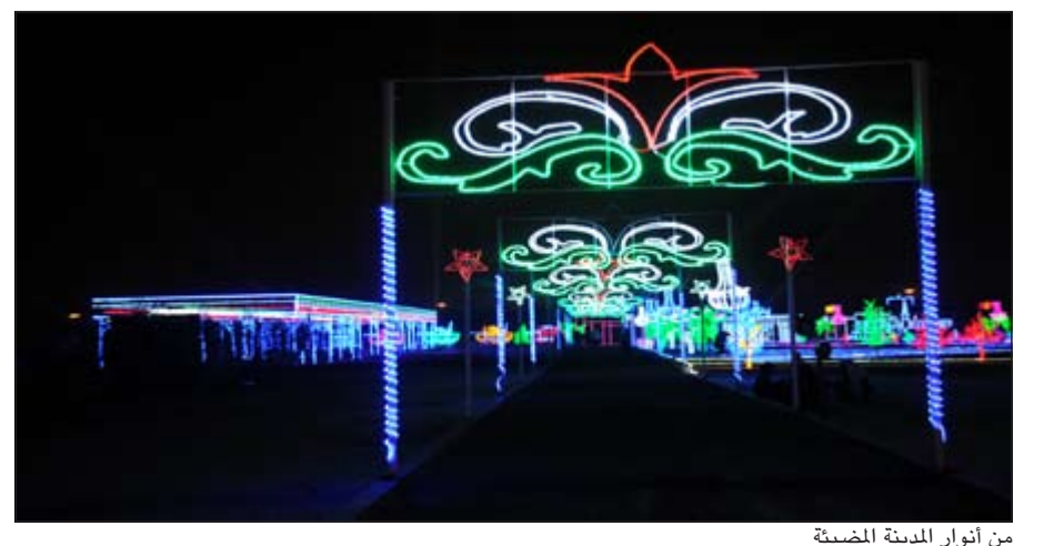
من أنوار المدينة المضيئة