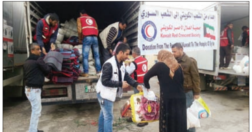
جانب من مساعدات جمعية الهلال الأحمر الكويتي في الأردن

عمان - بيروت - كونا: واصل الفريق الميداني لجمعية الهلال الأحمر في الأردن أمس تنفيذ مشاريعه الاغاثية للاجئين السوريين بتوزيع المساعدات الإنسانية على 500 أسرة في منطقة الشجرة شمالي الأردن.