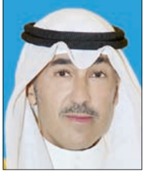
الشيخ فواز الخالد

كما بعث محافظ الاحمدى ببرقيات مماثلة الى سمو الشيخ سالم العلي رئيس الحرس الوطني ونائب رئيس الحرس الوطني