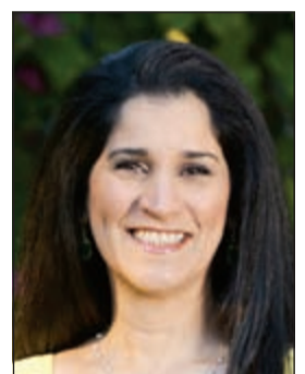
الشيخة انتصار سالم العلي

متعددة بالكويت للجولس قليلا والشعور بالراحة ثم التنفس والتأمل لما حولنا لنرى الجمال الذي يحيط بنا فالجمال قيمة مرتبطة بالشعور بالإيجابية فإن كنت إيجابيا فسترى كل من حولك جميلاً والعكس صحيح.