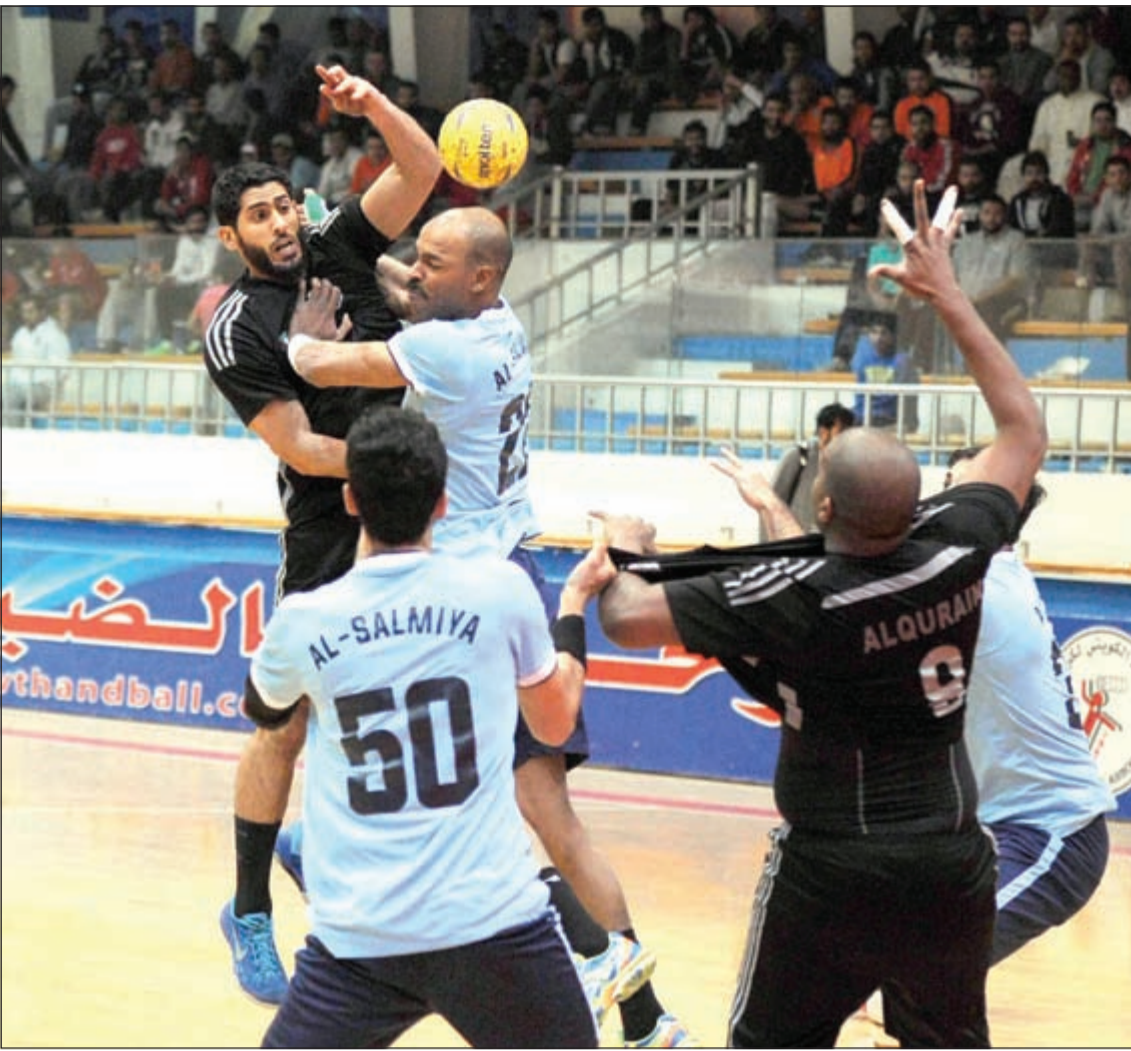
مباراة ثارية بين الساموي والقرين