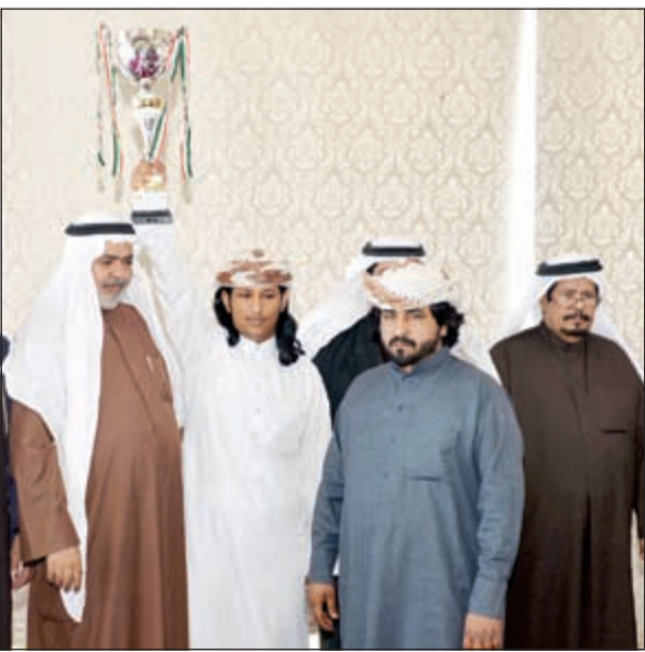
وفائز بكأس أخرى في السباق