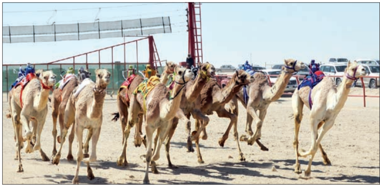
انطلاق سباق الهجن في يومه الثاني