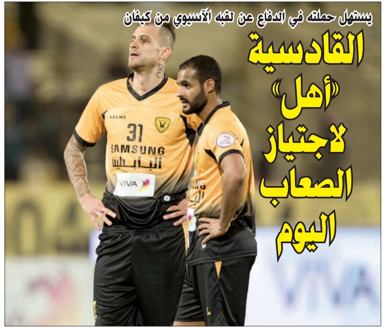
(الأزرق - كوم)

يستعمل حملته في الدفاع عن لقبه الآسيوي من كيفان