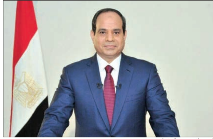
الرئيس المصري عبدالفتاح السيسي

ممارستها لكل أو بعض أوجه نشاطها أو مقاومتها. وتنص المادة الثانية على أن تعد النيابة العامة قائمة تسمى «قائمة الكيانات الإرهابية»، تدرج عليها الكيانات المنصوص عليها بالمادة الأولى، من هذا القانون، التي تصدر في شأنها أحكام جنائية تقضي بثبوت هذا الوصف الجنائي في حقها، أو تلك التي تقر الدائرة المختصة بمحكمة استئناف القاهرة المنصوص عليها بالمادة الثالثة من هذا القانون إدراجها بالقائمة. ووفقاً للمادة الثالثة، تختص إحدى دوائر محكمة استئناف القاهرة بنظر طلبات الإدراج على قائمة الكيانات الإرهابية التي يقدمها النائب العام من كشف التحقيق عن دليل بتوافر الوصف الجنائي المحدد بالمادة الأولى.