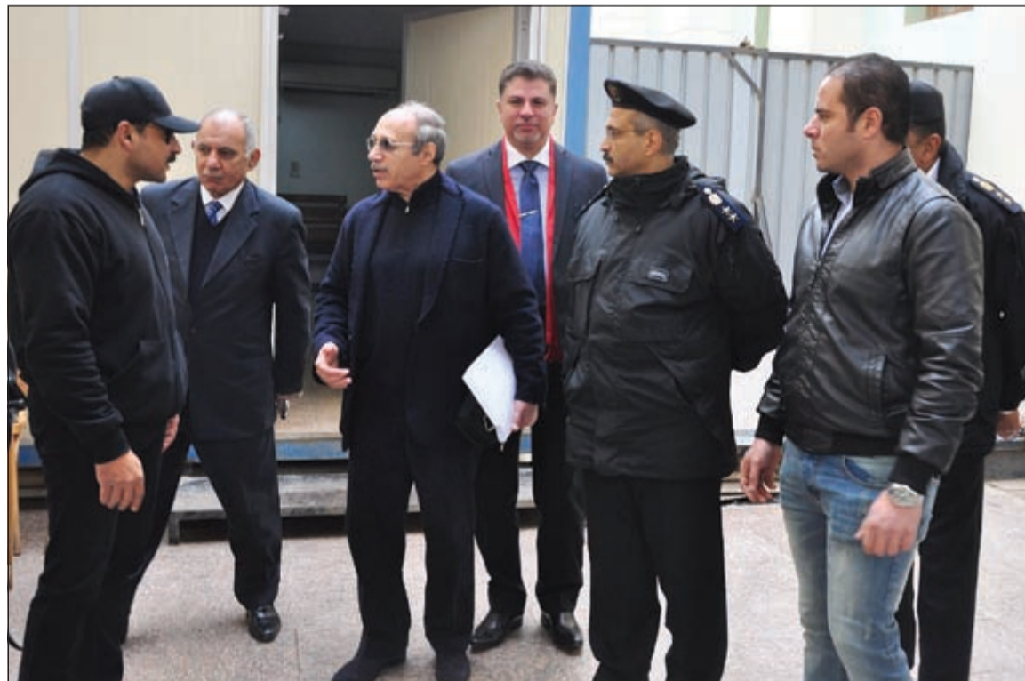
محامي العادلي في حديث جانبي خارج قاعة المحكمة عقب الحكم

القاهرة - وكالات: قررت محكمة جنابات القاهرة برئاسة المستشار بشير عبدالعال أمس تيرئة أحمد نظيف وحبيب العادلي رئيس الوزراء ووزير الداخلية، إبان حكم الرئيس الأسبق حسني مبارك، من الاتهامات الموجهة إليهما في قضية فساد مالي، وعرفت إعلامياً بـ «اللوحات المعدنية»، بحسب مصدر قضائي.