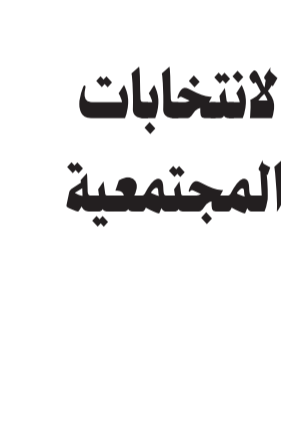
شيخ الأزهر د. أحمد الطيب

سيظهر في أوروبا وأمريكا إذا لم يعمل العالم معاً، وهو بالفعل ما حدث وبعد كلامه بفترة ليست بالطويلة. وعن أسباب الإرهاب، بين أن أول سبب من وجهة نظري هو التربص بالأمة الإسلامية والعالم العربي، ومحاولة تفتيته، والمشروعات التي نسجم عنها ما بين الفينة والأخرى، مثل الشرق الأوسط الكبير وغيره، وهذه المشروعات وراء قوى عالمية تتعاون مع الصهيونية العالمية، ذلك يعد من أبرز الأسباب.