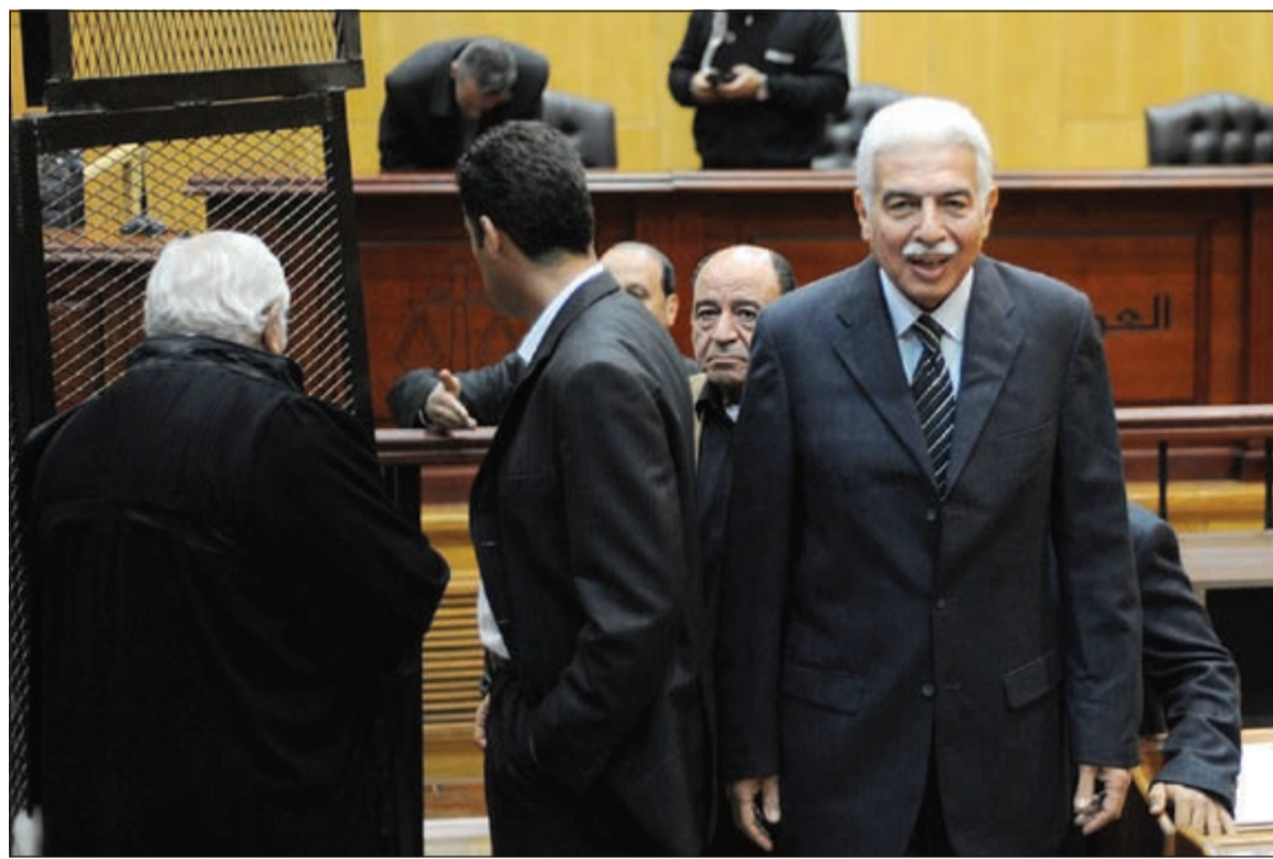
أحمد نظيف يغادر قاعة المحكمة عقب النطق بالحكم أمس