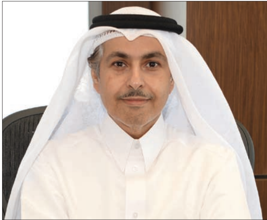
الشيخ سعود بن ناصر آل ثاني

وأشارت الشركة إلى ان صافي الأرباح المجمعة لربع السنة تأثر بالاستثمارات التي قامت بها الشركة بهدف استقطاب العملاء في الجزائر من حيث الحصول على حصة في سوق أنظمة الجيل الثالث، وبلغ صافي الربح لسنة 2014 ما مجموعه 17,1 مليون دينار مقارنة بمجموع صافي الأرباح البالغ 57,2 مليون دينار في عام 2013 ويتضمن خسائر العملات الأجنبية بسبب انخفاض قيمة الدينار الجزائري. بلغ صافي الربح العائد لـ «Ooredoo» عن العام 2014، 12,1 مليون دينار كويتي (41,3 مليون دولار أميركي) مقارنة مع 3,6 مليون دينار عن العام 2013. وأما صافي الربح العائد لـ «Ooredoo» خلال العام 2014 فبلغ 1,3 مليون دينار مقارنة بصافي الربح العائد لـ «Ooredoo» والذي بلغ 2,0 مليون دينار في سنة 2013.