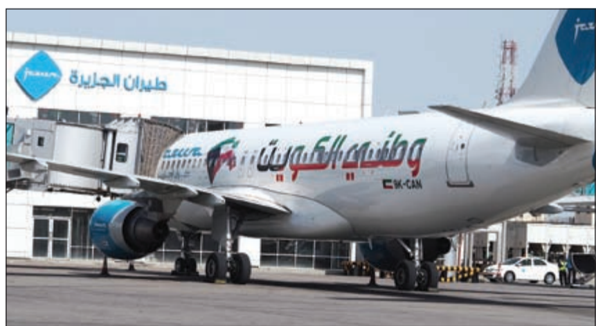
«طيران الجزيرة» تحتفل بأعياد الكويت الوطنية

وتوفر الشركة قيمة إضافية في الخدمات التي تقدمها للمسافرين، منها خدمة الحجز والتسجيل عبر لصعود الطائرة عبر الإنترنت على الموقع الإلكتروني وتطبيقات الهاتف الخاصة بالشركة، وأيضا التسجيل الذاتي عبر الأجهزة المخصصة بذلك في مطار الكويت الدولي، بالإضافة إلى أربع بوابات في مطار الكويت الدولي، مزودة بجسرين من أحدث الأنواع وأكثرها تطوراً، ونسبة التزام بمواعيد السفر من أعلى في الشرق الأوسط، بلغت نسبة 95% في الربع الأخير من عام 2014.