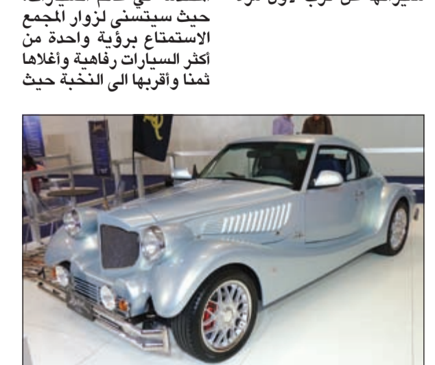
سيارة بافوري 2

كشفت شركة مجموعة السلام القابضة الوكيل الحصري لتسويق سيارة النخبة «بافوري» التي تعد القمة في الفخامة والرفاهية بالشرق الأوسط وشمال أفريقيا، عن أنها ستقوم بعرضها في مجمع الأقبوز – دووم 3 – حتى يتسنى للجمهور التعرف عليها وعلى مميزاتها عن قرب لأول مرة