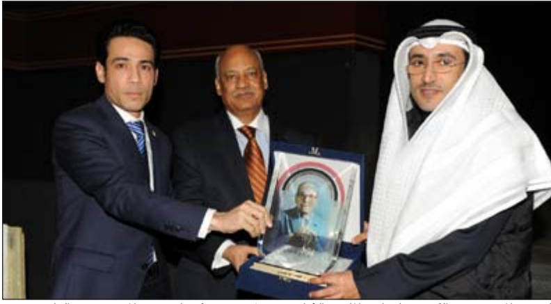
السفير المصري عبدالكريم سليمان والملحق الثقافي دنيل بهجت يكرم عميد المعهد د.فهد الهاجري