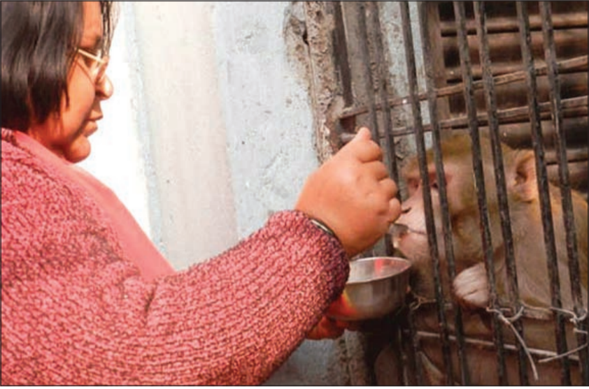
الزوجة تطعم القرد «الورث».

صندوق خاص لجمع تبرعات لصالح إنقاذ القرد، وتشيد مراكز خاصة لإعادة تأهيلها. وقالت شابيستا لـ «سي» ان.ان: «الناس في الهند لا يأبهون بالحيوانات، لكني أشعر أنهم كالإنسان، بحاجة للحب والحنان».