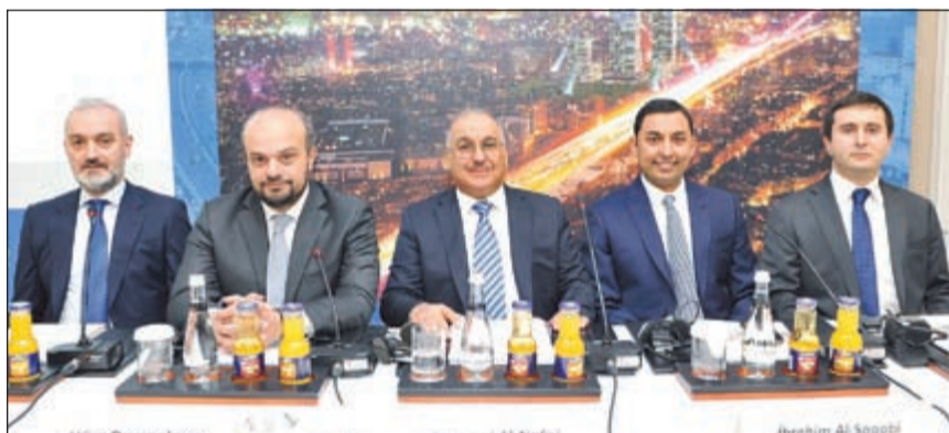
جانب من المؤتمر الصحافي

وأضاف الصقعي: وإننا على ثقة كاملة بحجم الطلب المتنامي على هذه المشاريع من داخل وخارج تركيا، وعليه فقد تم إعداد خطة كاملة مع شركة دومانكايا لتوسيع دائرة تسويق المشروع لتشمل الكويت والسعودية والإمارات وعمان والبحرين وذلك لاكتشاف المزايا على هذه الأسواق وتواجدها في معظمها من خلال مكاتب عملياتها المتعددة.