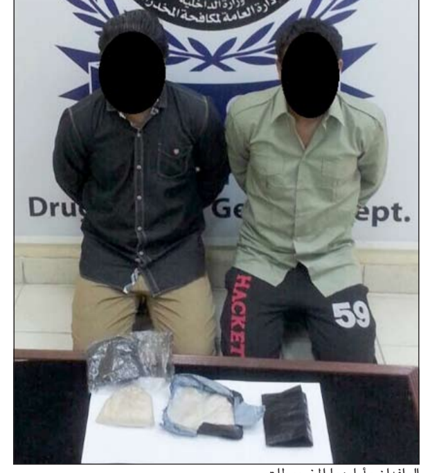
الوافدان وإمامهما المضبوطات

تمكنت إدارة مكافحة المخدرات التابعة للإدارة العامة لمكافحة المخدرات من ضبط شخصين آسيويين بحوزتهما كيلوغرام من مادة الهيروين المخدرة. وقد وردت معلومات إلى الإدارة العامة لمكافحة المخدرات «إدارة المكافحة الدولية» تفيد بأن هناك وافداً آسيويا يقوم بالاتجار في المواد المخدرة وبعد إجراء التحريات اللازمة واستصدار الإذن القانوني اللازم تمت مدهامة مسكنه، حيث كان برفقته شخص من نفس جنسيته، وبتفتيشهما وتفتيش مسكنهما عثر على كيلوغرام من مادة الهيروين المخدرة، وبالتحقيق معهما إقراراً بالمواد المخدرة تخصهما بقصد الاتجار. وتمت إحالة المتهمين إلى جهة الاختصاص.