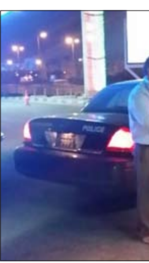
عامل المحطة وتبدو الدماء تغطي ملابسه