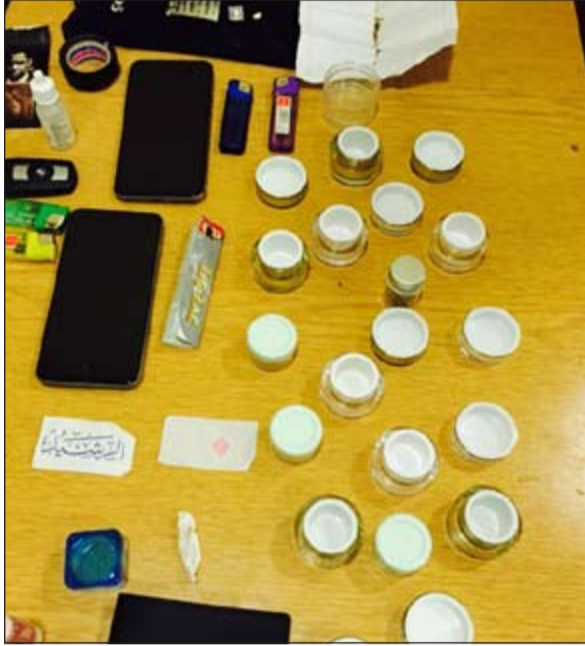
من مضبوطات الأمن العام