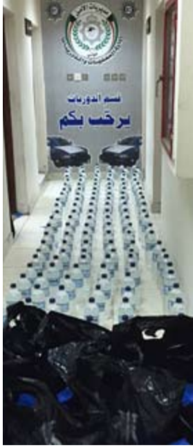
الخمور المضبوطة في شارع عمان