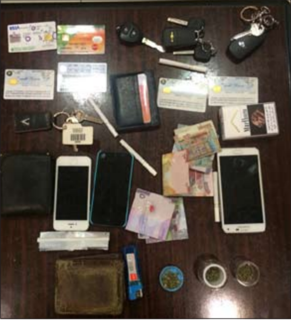
أدوات تعاط و مواد مخدرة أحييت إلى «المكافحة»