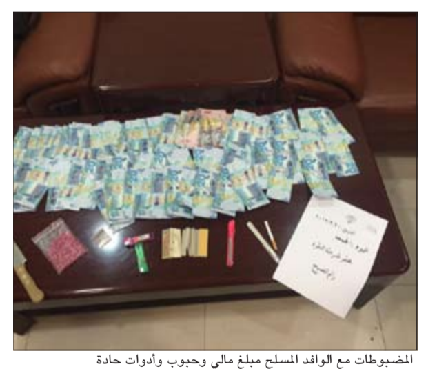
المضبوطات مع الوافد المسلح مبلغ مالي وحبوب وأدوات حادة

احتجز وأشد مصري في نظارة مخفر النقرة لحيازته مواد مخدرة ومحاولة السطو على بنك محلي. وبحسب مصدر أمنى فإن بلاغا ورد إلى عمليات الداخلية في ساعة متأخرة من مساء يوم الجمعة عن شخص مسلح داخل البنك، وقال المصدر أن رجال أمن حولي انتقلوا إلى موقع البلاغ وتمكنوا من السيطرة على البلاغ ومقاومة عنيفة، وبتفتيشه عثر معه على 88 حبة مخدرة وعدد 2 آلة حادة وموس وسكين إلى جانب مبلغ فاق الـ 2000 دينار.