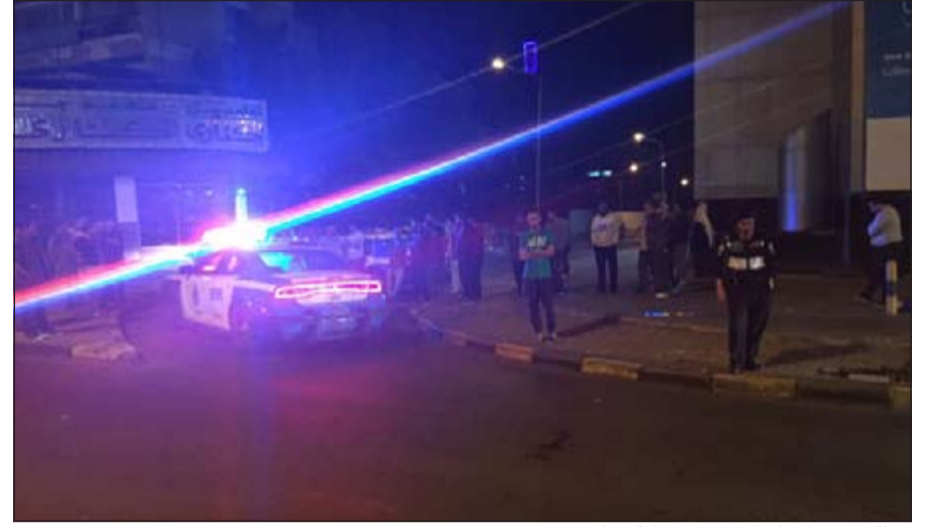
نقطة تفتيش لرجال المرور في منطقة حولي

من جانب آخر، قام رجال المرور بتحرير نحو 180 مخالفة مرورية على المركبات المتوقفة في الطرقات المحيطة بسوق الجمعة لمنع وقفها بعد أن تسببت في عرقله السير.