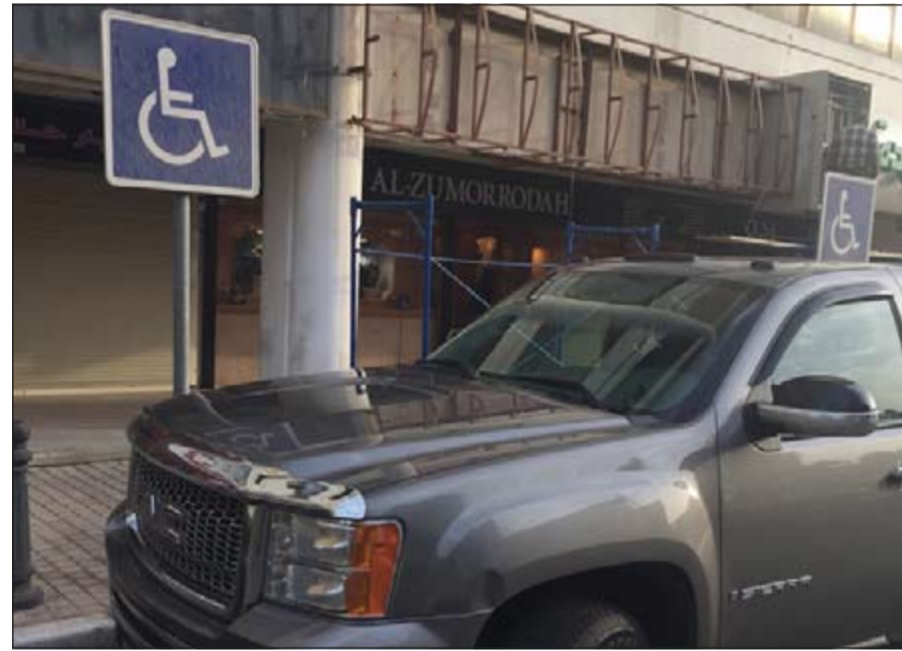
مخالفة المركبات المتوقفة في مواقف ذوي الاحتياجات الخاصة