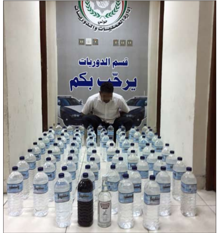
المتهم وامامه المضبوطات