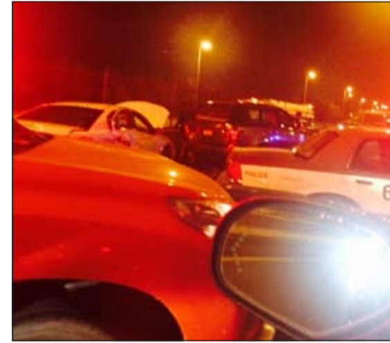
الحادث الخماسي الذي شهده الدائري السادس