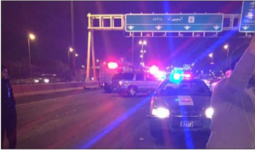
إغلاق الطريق بسبب الحادث