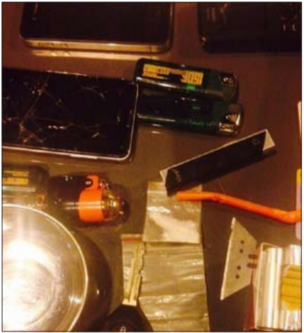
كثيرة من المضبوطات أثناء الحملة