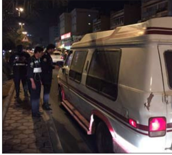
التدقيق على شروط الأمن والمناطة