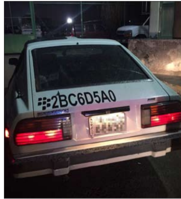
مركبة تم حجزها بعد الاستعراض

شاطئ المسيلة كما تم تحرير مخالفات لعدد من البانسيات خلال الحملة.