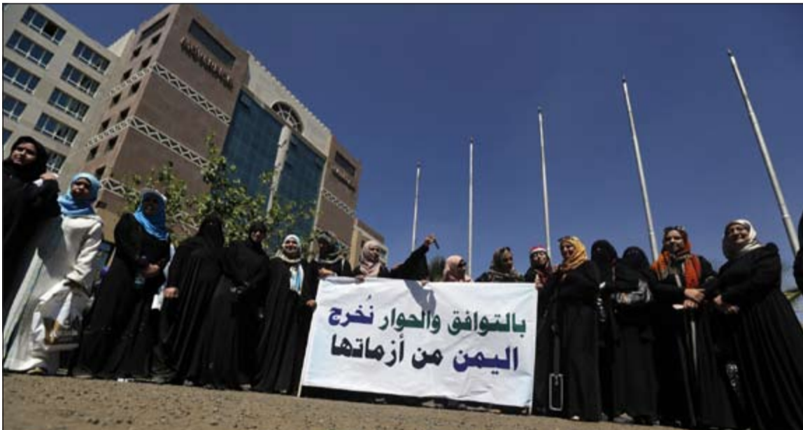
يمنيات يرفعن لافتة تدعو لتغليب لغة الحوار لحل الأزمة في البلاد خلال تظاهرة بصنعاء امس الاول

ولفتت بساكي الي ان واشنطن حذرت شركاها «حول اهمية الاستقرار في المنطقة ومن التبعات التي تتخطى المستوى الأمني».