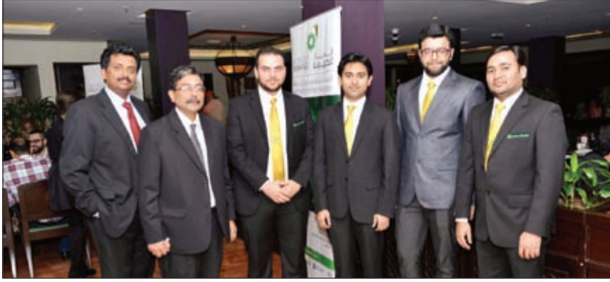
من فريق عمل شركة الملا العالمية للصيرفة

كجزء من احتفالاتها السنوية، أقامت شركة الملا العالمية للصيرفة حفل عشاءها السنوي في مطعم ميس الغانم لشكر وتقدير أهل الصحافة والإعلام على دعمهم للشركة خلال العام الماضي، وشهد الحفل حضور أكثر من 50 مدعوا من وسائل الإعلام وموظفي وإداريي شركة الملا العالمية للصيرفة. بدأ الحفل بترحيب حار من إدارة الشركة الذين كانوا في استقبال الضيوف لدى وصولهم وشكرهم للمساهمة في جعل 2014 عاما ناجحا، وبدعمهم يستمر النجاح خلال 2015.