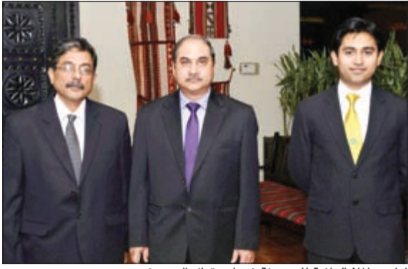
إداريو الملا العالمية للصيرفة في استقبال الضيوف