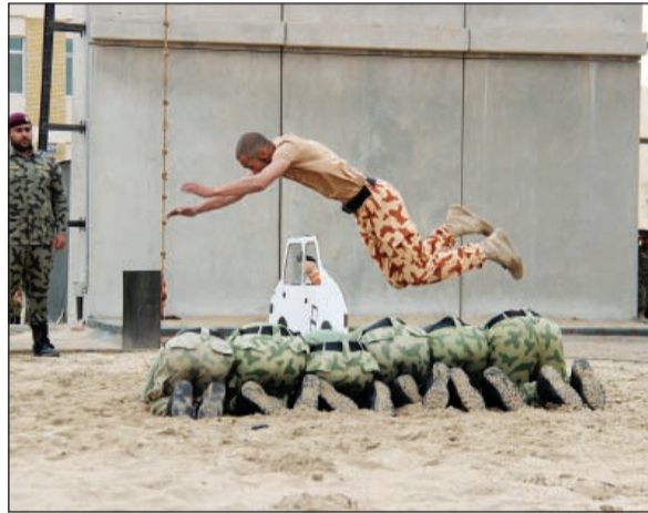
شجاعة وقوة في التدريبات

جميع الأماكن كالمناطق الزراعية والصحراوية وداخل المدن والميادين. كما كشف خريجو دورة فض الشغب عن تمتعهم بدرجة عالية من اللياقة البدنية وقوة التحمل ومستوى راق من الثقة بالنفس والقدرة على مواجهة المخاطر وإتقان جميع الفنون القتالية.