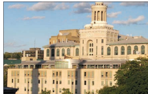
جامعة كارنيجي ميلون

من أقلية، نسبتها أقل من 9٪ من المرشحين البالغ عددهم