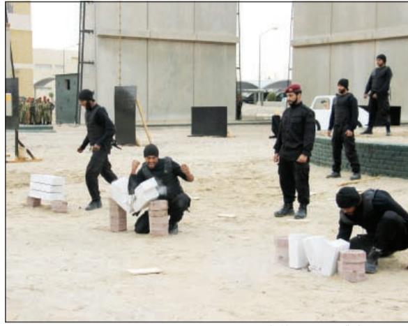
قوة وشجاعة في تنفيذ المهام