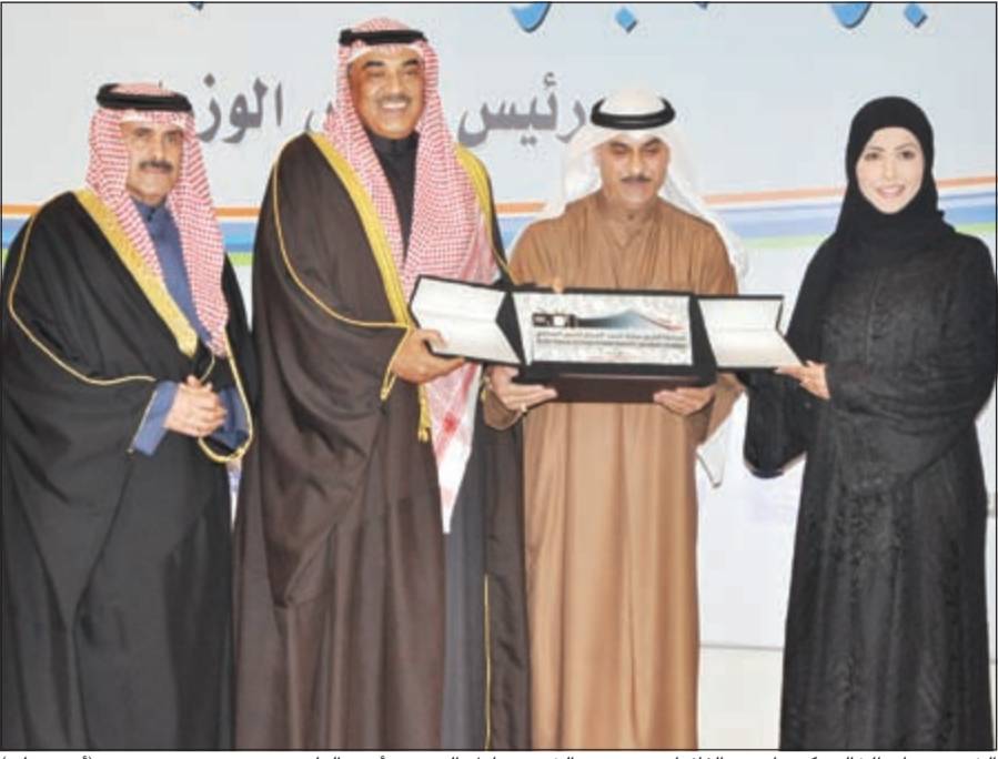
الشيخ صباح الخالد يكرم إحدى الفائزات بحضور الشيخ مبارك الدعيج وأمين العلي (أحمد علي)