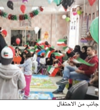
جانب من الاحتفال