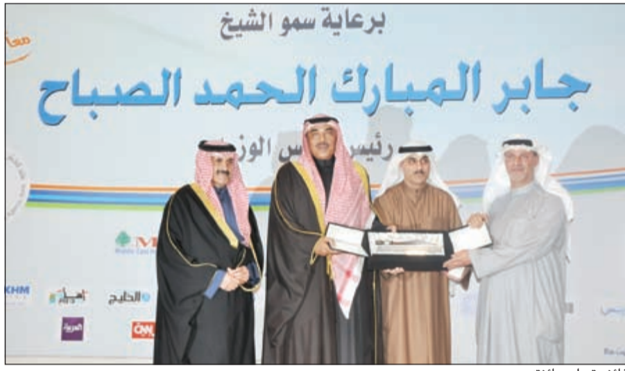
فائز يتسلم جائزته

«ونأمل ان يكون لها دور أكثر فاعلية وتأثيرا في مسيرة التطور والتقدم التي نتطلع إليها جميعا». من ناحيته، قال رئيس اللجنة العليا للمسابقة أيمن العلي إن تكريم كوكبة من الصحفيين المتميزين الفائزين بجوائز المسابقة يأتي ثمرة من يجتهد ويعمل ليبلغ غايته وهدفه مهما كان بعيدا وشاقا، ما تؤكد الأعمال الفائزة بجوائز الدورة السابعة من المسابقة، وأضاف ان دورة هذا العام من التدريبية مكثفة في مؤسستي النهار والجزيرة الإعلاميتين بما لهاتين المؤسستين من مكانة في الإعلام العربي. وقال العلي: «إننا سنتابع في هذه الدورة هذا المشوار مضيئين إليه مؤسسات إعلامية عريقة أخرى وذلك بدعمنا للقدرات الشبابية المتطلعة الطموحة التي تمثل مستقبل الإعلام الكويتي وعملا على إمداد تلك المواهب المبدعة بكل ما هو جديد على الصعيد المهني للصحافة العالمية». وأكد ان الصحافة عليها ان توحد ولا تفرق، تبني ولا تهدم، تعمر ولا تدمر، وفي سعي حثيث لاستكمال الشعار الذي رفعتة هذا الدورة «معا لإعلام بناء»، فمن شأن إعلام كهذا أن يبتكر رؤيته الثقافية الإيجابية لينواجه تلك المخاطر والانعرجات التي تعترض مستقبل هذه الأمة فضلا عن إسهامه في تعزيز التعاون المشترك ووحدة الصف المحلي والقومي والإقليمي.