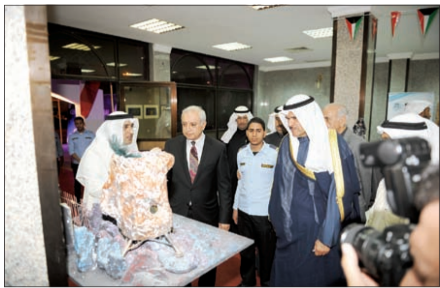
الوزيران العيسى والحمود في جولة بالمعرض الفني