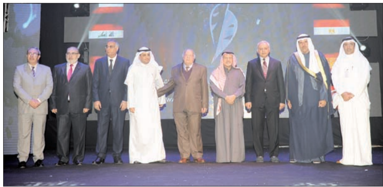
أعضاء لجنة التحكيم للدورة الخامسة لمهرجان «الأكاديمي» مع الوزيرين العيسى والحمود