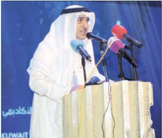
عميد المعهد العالي للفنون المسرحية رئيس المهرجان د.فهد الهاجري