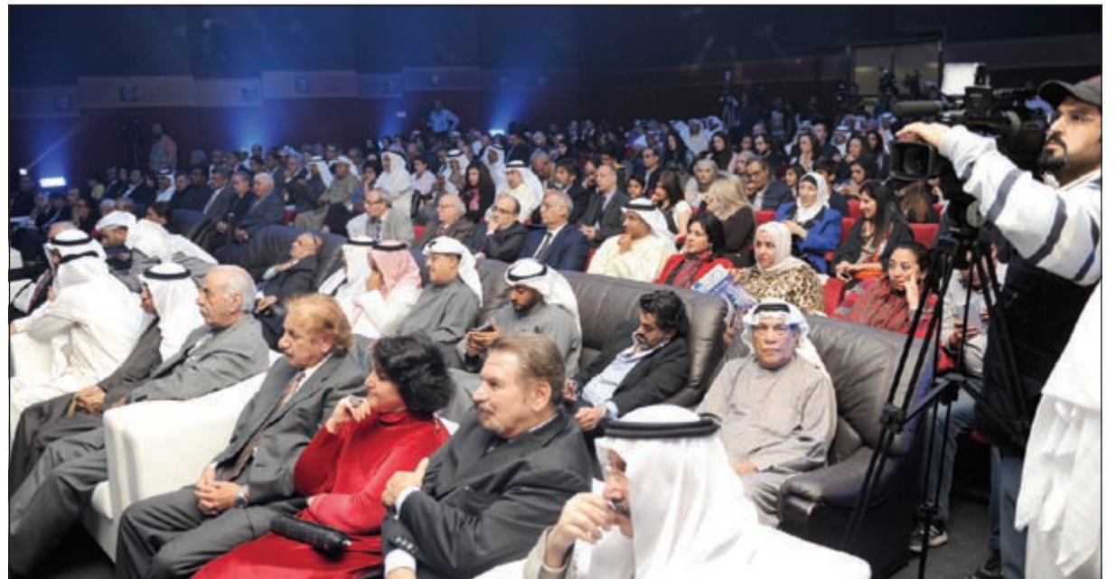
حشد كبير من الفنانين والإعلاميين والجمهور في افتتاح الدورة الخامسة للمهرجان