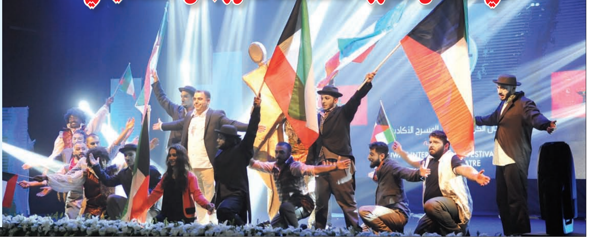
هاني النصار وفريق مسرحية «الممثل» بعد انتهاء العرض