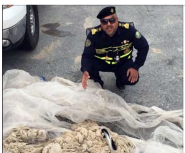
الخيوط بعد ضبطها

المبلغ التأكيد على ان بطاقة السحب الألي بحوزته، وسجل قضية تزوير في محرر بنكي برقم 2015/4. وقال مصدر امني