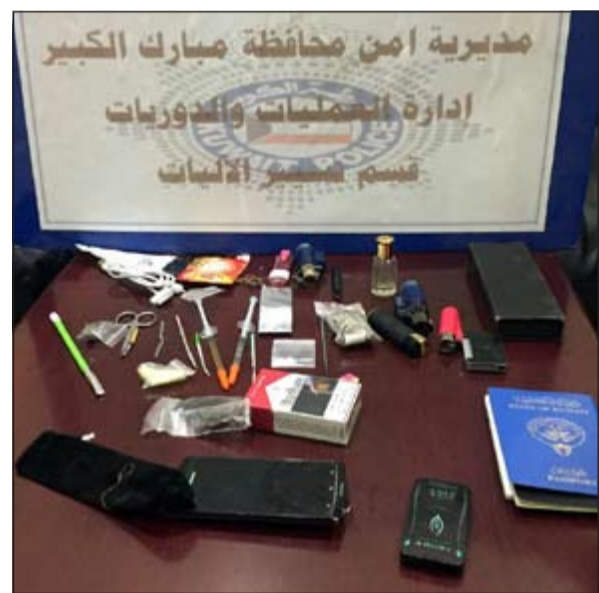
من ضبطيات الأمن العام