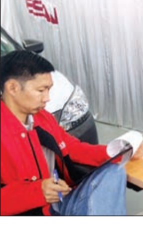
.. واختبار مهارات التعامل