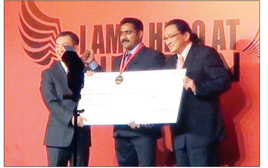
الفائز بالميدالية الذهبية