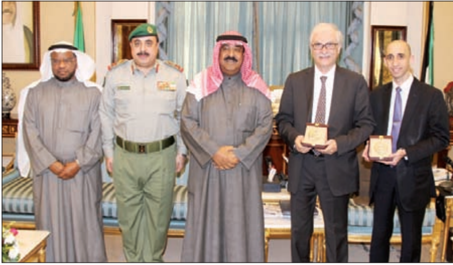
الشيخ مشعل الاحمد خلال استقباله د.كاظم بهبهاني والوفد المرافق