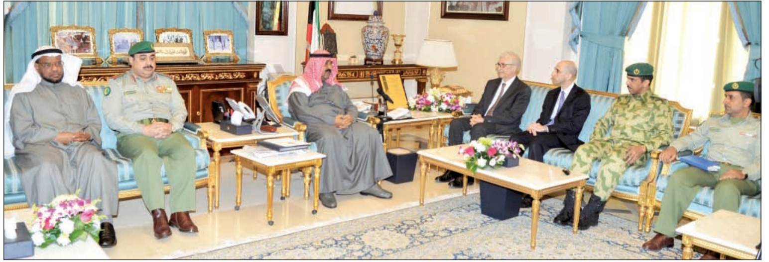
الشيخ مشعل الاحمد خلال اللقاء مع وفد المعهد

الحرس الوطني وقع بروتوكول تعاون مع معهد دسمان لأبحاث وعلاج أمراض السكر