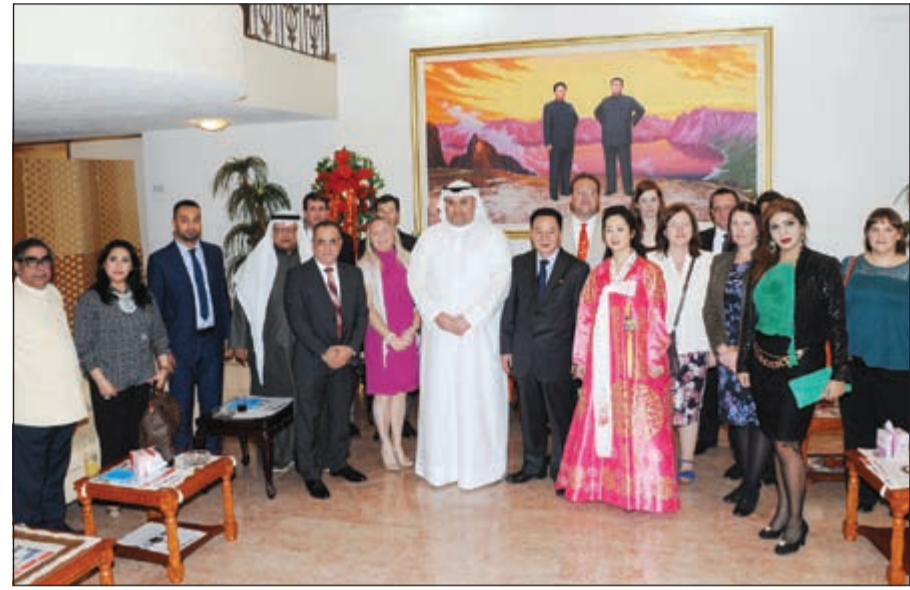
السفير الكوري سوتشانغ سيك وجرمه يتوسطان المشاركين في الاحتفال