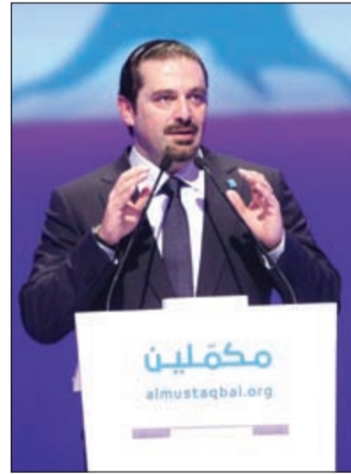
سعد الحريري يلقيا كلمته في بيروت أمس

وكالات: أكد رئيس الوزراء اللبناني الأسبق سعد الحريري أن الحوار مع حزب الله حاجة وضرورة مرحلية وليس ترقياً سياسياً، مضيفاً «إننا لن نعترف لحزب الله بأي حقوق تتقدم على حق الدولة في قرارات الحرب والسلام وتجعل من لبنان ساحة أمنية وعسكرية يسخر من خلالها إمكانيات الدولة لإنقاذ النظام السوري وحماية المصالح الإيرانية». ودعا في كلمته التي ألقاها أمس من قاعة البيلال، بمناسبة الذكرى العاشرة لاغتيال والده في بيروت، حزب الله إلى الانسحاب من سورية، وإلى عدم الرهان على إنقاذ النظام السوري، لأن هذا الرهان هو وهم يستند إلى انتصارات وهمية وعلى قرار إقليمي بمواصلة تدمير سورية.