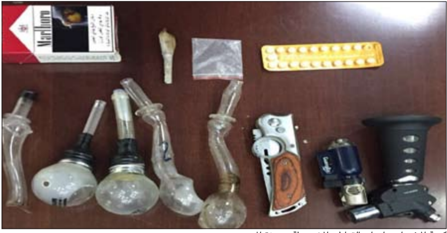
كمية المخدرات وادوات التعاطي المضبوطة بحوزة المدمن