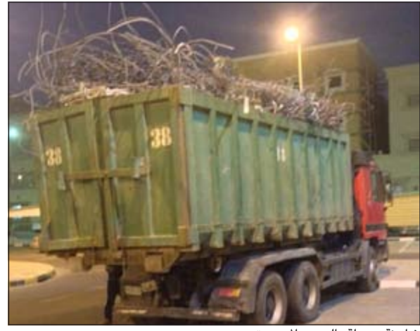
شاحنة محملة بالحديد السروق