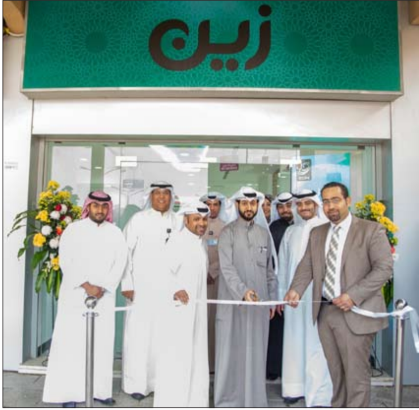
جانب من افتتاح الفرع الجديد في منطقة بيان