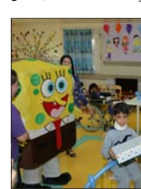
متطوعو البنك مع الأطفال

قام عدد من موظفي بنك بوبيان من المتطوعين في فريق خدمة المجتمع بزيارة إلى قسم الأطفال في مستشفى الرازي ضمن حملة البنك الخاصة بالاحتفال بإيام الكويت الوطنية تحت شعار «بوبيان يفرحهم»