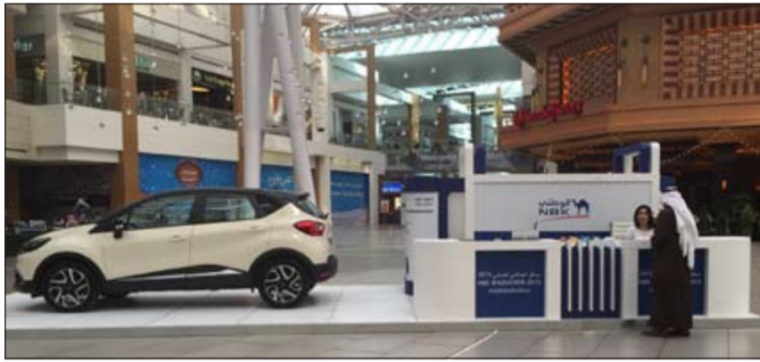
مركز التسجيل في سباق البنك الوطني للمشي في مجمع الأقنيوز

يوم السبت في 7 مارس 2015 بتخلله برنامج متكامل يتضمن العديد من المفاجآت والجوائز القيمة للمشاركين والمتسابقين. ويتوجح البنك الوطني أكثر من 120 فائزاً في ختام السباق. ويقسم المشاركون في السباق إلى اثنتي عشرة فئة، حيث سيتم اختيار أول عشرة فائزين عن كل فئة. وسوف تكون نقطة بداية سباق مشي الرجال من أمام أبراج الكويت، في حين ستكون نقطة انطلاق سباق مشي النساء من أمام سوق شرق، أما بالنسبة للأطفال