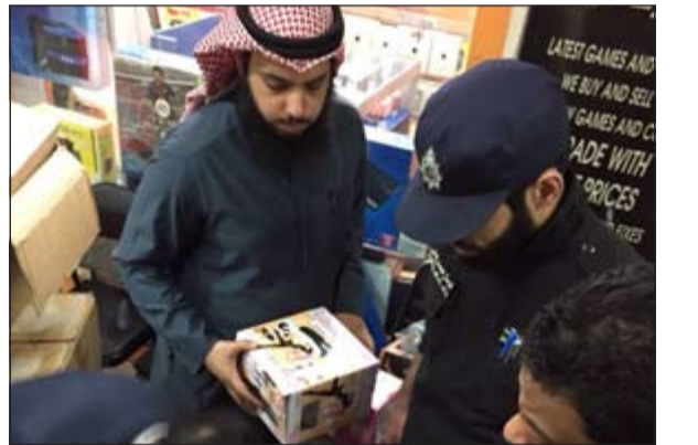
رجال الامن والتجارة يصادرون الألعاب المخلة

أرسلت مديرية أمن حولي دوريتين امبئتين برفقة فريق طوارئ وزارة التجارة وذلك بعد بلاغ من مواطنة قالت فيه انها ذهبت إلى احد محلات بيعع ألعاب الاطفال وحصلت ألعابا مخلة بالأداب، وأشار المصدر الى ان فريق الطوارئ داهم المحل وصادر الألعاب المخالفة للأداب.