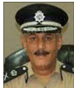
اللواء زهير التمزلله