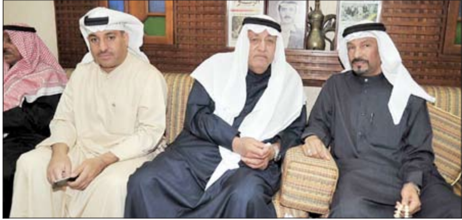
السمو السابق علي المؤمن واثان من الحضور

الانسانى كان بمنزلة جسر للعلاقات الدولية والتي كانت مبادرة فيها مصلحة للبلدين، كما لا ننسى توجيهات صاحب السمو في شتى المناسبات بتقديم المساعدات الإنسانية، خاصة معالجة المرضى العراقيين في مستشفيات أميركا وأوروبا.