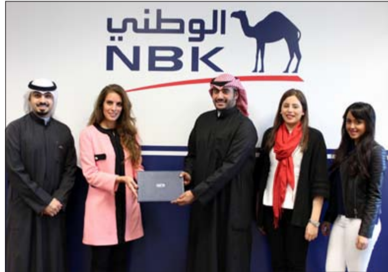
البنك الوطني يقدم رعايته لنادي العلاقات الدولية في الجامعة الأميركية

الشباب. فإلى جانب برامج الرعاية الاجتماعية، يوفر البنك الوطني العديد من البرامج التدريبية للطلبة والخريجين والتي تهدف إلى الاستثمار في الشباب وتمكينهم وتطوير خبراتهم العملية في المجال المصرفي والمالي. وتأتي رعاية البنك الوطني لنادي العلاقات الدولية في الجامعة الأميركية انسجاماً مع توجهه الراسخ للمهوض بمسؤولياته الاجتماعية ودعم مختلف النشاطات التعليمية إيماناً منه بضرورة المساهمة في إنعاش وتطوير أداء مختلف المؤسسات التعليمية والأكاديمية في الكويت بموازاة الاهتمام بالطاقات الشبابية وتحفيزها على تطوير مهاراتها وكفاءاتها.