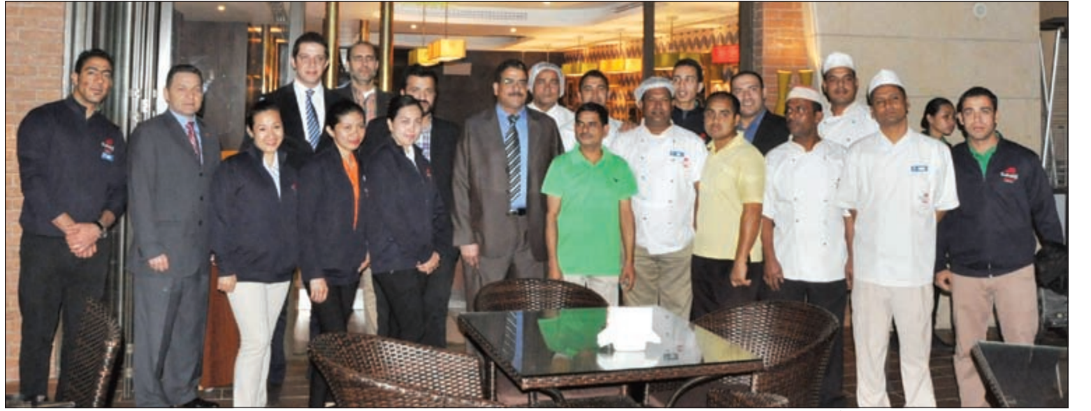
فريق عمل مطعم كبابجي في لحظة تذكارية أمام الفرع التاسع بمجمع ميرال