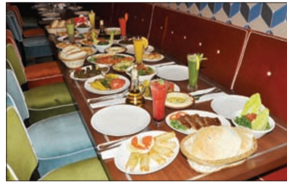
تشكيلة مميزة من المقبلات في مطعم كبابجي