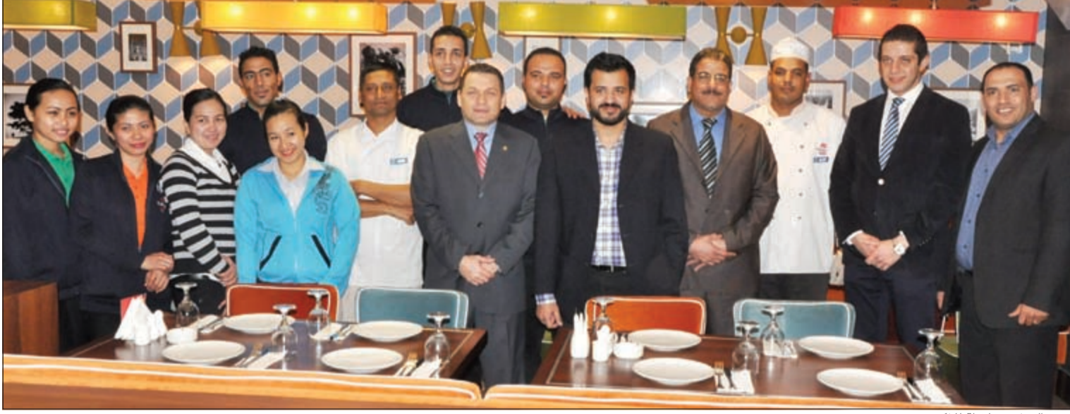
فريق العمل في لحظة للتكريم

بصبح عدد فروع سلسلة مطاعم كبابجي في الكويت تسعة، مما يؤكد التزام مجموعة كوت الغذائية بتنمية العلامة التجارية وتوسيع انتشارها. وانطلاقاً من هذا الهدف يتطلع القيمين في المجموعة للحفاظ على مكانة كبابجي المميزة من خلال الاستمرار في تقديم أجود المأكولات وأفضل خدمة لرواده. ومجموعة كوت الغذائية (الشركة الأم)، هي شركة كويتية مساهمة مغلقة ومدرجة في سوق الكويت للأوراق المالية. تعمل الشركة الأم وشركائها التابعة في مجال تشغيل المطاعم ذات الطابع الدولي والمحلي في كل من الكويت والمملكة المتحدة وأربيل (العراق) وخدمات التموين واستيراد وتصدير المواد الغذائية وتمثيل الشركات الأجنبية وتقديم المشورة في مجالات هذه الأنشطة. تتضمن العلامات التجارية للمجموعة في الكويت مطاعم «برجر كنج»، «بيتزا هت»، «تاكو بل»، «أبل بيز»، «كبابجي»، و«برج الحمام»، كما سلسلة مطاعم «أيامي» و«سكوب آون».