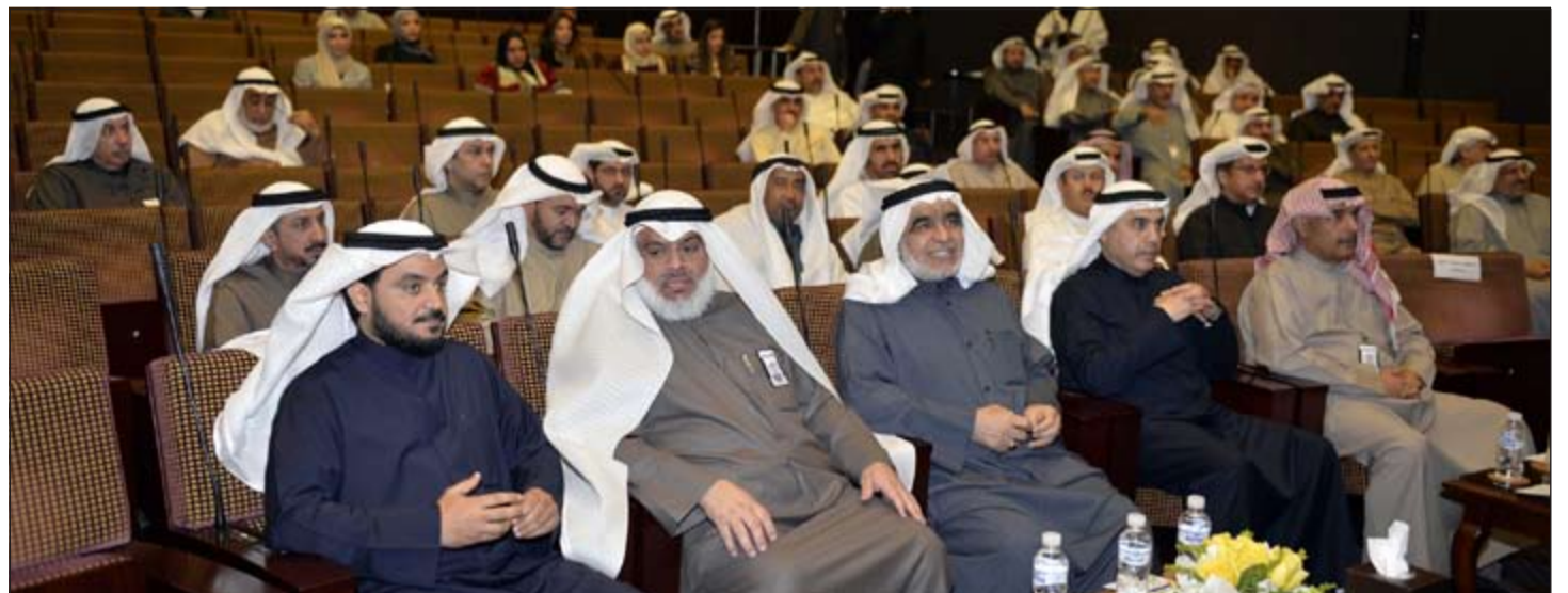
جانب من زيارة أعضاء لجنة الميزانيات البرلمانية إلى ديوان المحاسبة

وأشار إلى وجود تقارير قديمة على جدول أعمال المجلس إن تتم مناقشتها حتى