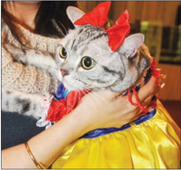
فكرة أجمل ازياء القطط