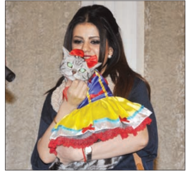
لحدى المشاركات تحمل قطنها