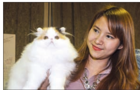
قطة جميلة مشاركة