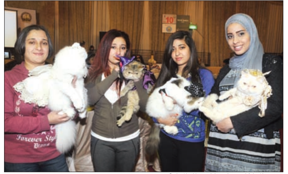
عدد من المشاركات يحملن قططهن خلال المسابقة