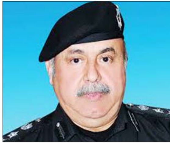
الفريق سليمان الفهد