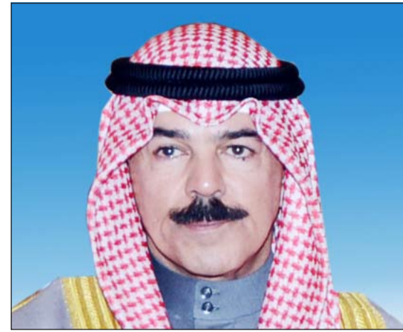
الشيخ محمد الخالد

خلال فترة السماح. صرحت بذلك إدارة الإعلام الأمني بوزارة الداخلية التي تقوم حالياً بالإعداد والتحضير لبدء انطلاق حملات التوعية والإرشاد بالقانون وما يسبق التنفيذ والتطبيق الفعلي من فترة سماح محددة بـ 4 أشهر.