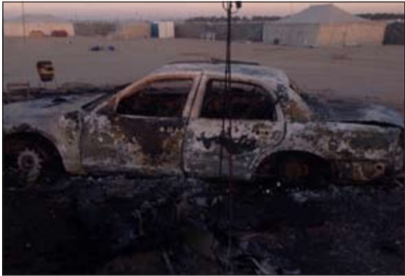
المركبة وقد تحنمت