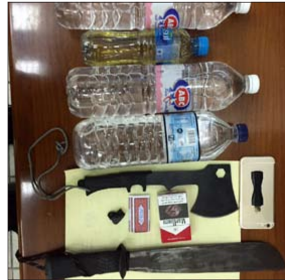
المضبوطات من الخمر المحلي والأدوات الحادة

من جهة أخرى، تمكن رجال «إدارة المكافحة المحلية» من إلقاء القبض على وأفدين عربيين يعملان في ترويج المخدرات.