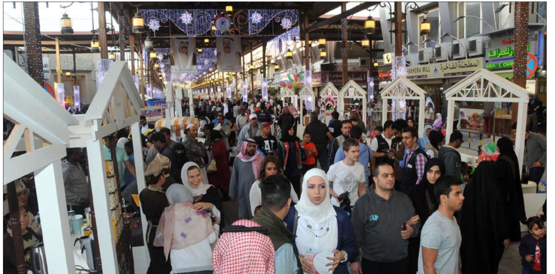
جانب من احتفالات الكويت في سوق المباركية هذه الأيام حيث تعرض الكثير من المنتجات المحلية وسط توقعات لـ «بيتك للأبحاث» بانخفاض أسعار المواد الغذائية على المدى البعيد (محمد هاشم)