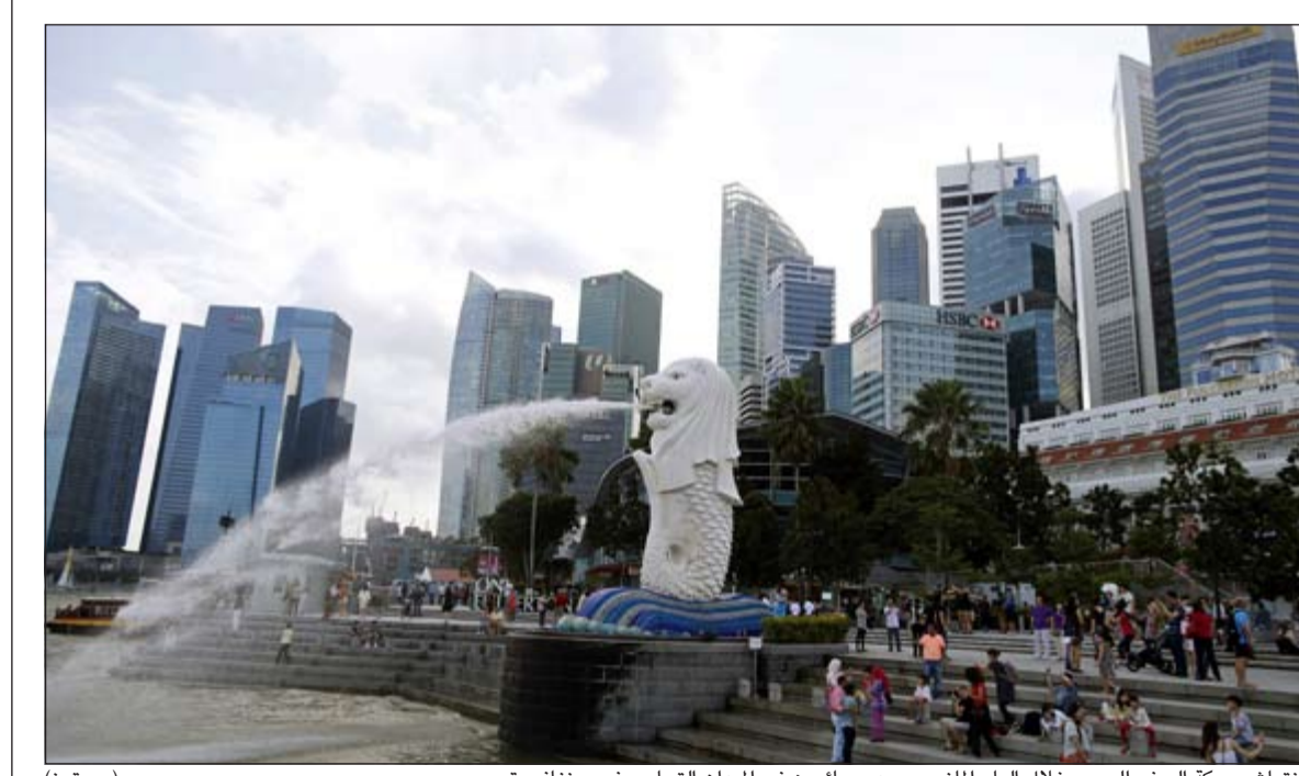
انتعاش حركة السفر الجوي خلال العام الماضي ويبدو سائحون في الميدان التجاري في سنغافورة

بنسبة 6,4%، أما نسبة إشغال الطائرات فبلغت 79,2%. وعلى متن الرحلات الأوروبية، ارتفع عدد المسافرين بنسبة 5,7% وبلغت نسبة اشغال الطائرات 81,6%. أما في أميركا الشمالية فبلغت نسبة إشغال عدد الركاب في الرحلات الجوية 3,1% وبلغت نسبة إشغال الطائرات 81,7%. وفي دول آسيا-المحيط الهادئ، بلغت نسبة الزيادة في عدد الركاب 5,8% وبلغت نسبة اشغال الطائرات 76,9%. وسجل المعدل الأعلى لارتفاع عدد المسافرين على متن طائرات منطقة الشرق الأوسط، وهو 13%. أما المعدل الأضعف للزيادة فسجل في أفريقيا، ولم تتخط نسبته 0,9%، من دون أن يكون ذلك متاثراً بوباء إيبولا. بحسب الإتحاد الدولي الذي يعزوه إلى الأوضاع الاقتصادية.