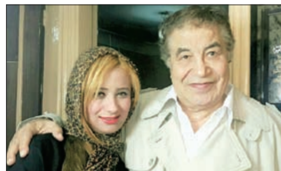
سعيد طرابيك مع زوجته سارة

وتفاحة آدم... وحالياً استعد لتصوير مسلسل «نصباية» مع مجموعة من الوجوه الشابة والفنان القدير سعيد طرابيك.. وفوازير رمضان مصفرة اتمنى ان تحقق النجاح. وعن حكاية زواجهما من الفنان القدير سعيد طرابيك، قالت: تزوجنا من 9 شهور تقريبا بعد ان اكتشفت انه صاحب قلب تقوي ويتمتع بمواصفات لم أجدها في الكثيرين منها حنانه وطيبه قلبه ومواقفه الإنسانية الرائعة ومساندته لي فنياً وإنسانياً وأشياء كثيرة ولم أشعر معه بفارق السن من ثلثي بسالتي الكثرين.. وأحمد الله انني اعيش معه في سعادة بسبب