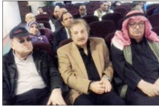
..يوم الفنان القدير محمد المنصور