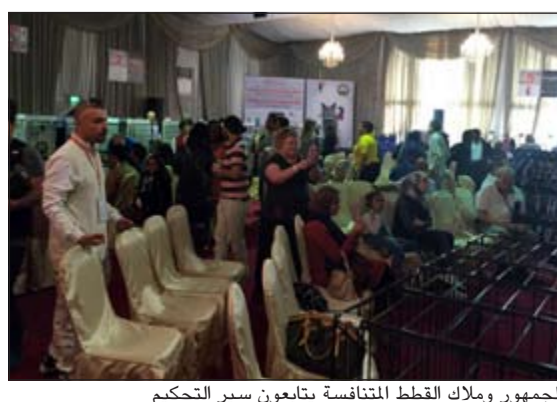
الجمهور وملاك القطط المتنافسة يتابعون سير التحكيم