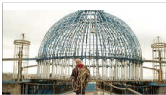
الراهب وسط الكاتدرائية

تدويرها، والأغراض التي تتطوع بها شركات أخرى. وتتكون الكاتدرائية من عدة أبراج، وسلسلة من القباب، وزجاج ملون، ودير، وأدراج لولبية، وبنيت الكاتدرائية على مساحة 24 ألف قدم مربعة. ولم يكن غاليفو يملك أي خبرة في البناء عندما بدأ العمل في المشروع، منذ أكثر من 50 عاماً. ودخل غاليفو الدير في سن العشرينيات من عمره، ولكنه أصيب بمرض السل.