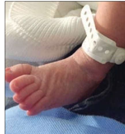
قدم مولود شاكير الجديد

نشرت النجمة شاكيراً صورة جديدة على صفحتها على أحد مواقع التواصل الاجتماعي.