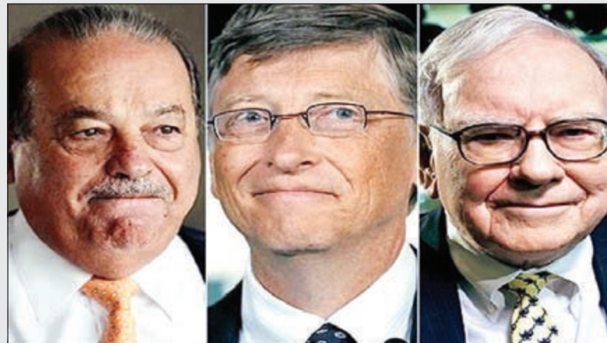
(من اليمين) وارن بافت وبييل غيتس وكارلوس سليم حلر

في لائحة «هورون»، كما يلفظون في الصين اسم المجموعة، احتل الأمريكي بيل غيتس، مؤسس شركة «مايكروسوفت» لبرامج الكمبيوترات، المرتبة الأولى كأغنى من في العالم، وبثروة بلغت 85 مليار دولار، بزيادة 25% عن 68 ملياراً كان يملكها في 2013 واحتل بها المرتبة الأولى أيضاً، مع أنه الأصغر بين