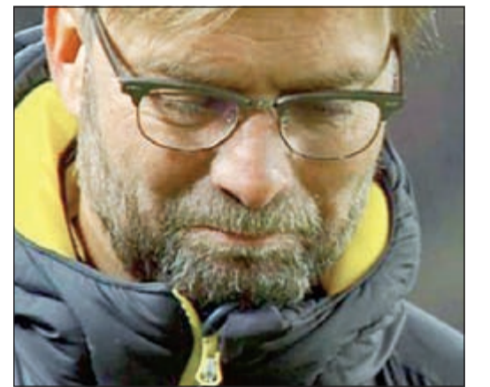
يورغن كلوب من المجد إلى القاع

يبسو أن الجماهير والصحافة الألمانية بدأت بالتحول من التعاطف إلى الاستياء من المدير الفني لفريق بوروسيا دورتموند يورغن كلوب. ونشرت صحيفة توتوميركاتو الرياضية الإيطالية أن الصحف الألمانية بدأت مهاجمة الفريق والتلميح إلى إمكانية عزل المدير الفني الذي حقق المجد مع الفريق الأصغر في الأعوام الماضية. دورتموند تلقى هزيمة أمام أوغسبورغ هي الحادية عشرة هذا الموسم ليتبدل ترتيب الدوري الألماني وليبدأ شبح الهبوط بشكل جاد يلوح في الأفق.