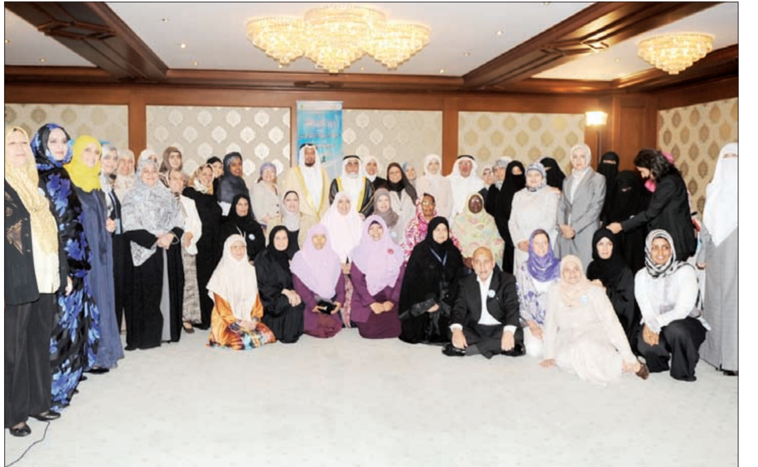
لطيفة الوزاني في مؤتمر المرأة العالمي