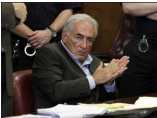
الرئيس السابق لصندوق النقد الدولي دومينيك ستراوس كان خلال محاكمته بتهمة القوادة

بدأت أمس الأول محاكمة الرئيس السابق لصندوق النقد الدولي دومينيك ستراوس كان في مدينة ليل شمال فرنسا بتهمة ممارسة القوادة بعد تحقيق مطول بشأن حفلات جنسية شارك فيها الرجل الذي تجاوزت أحواله بمنصب الرئاسة في أعقاب فضيحة جنسية بالولايات المتحدة عام 2011. والرجل الذي كان يساعد على حلحلة الأزمات الاقتصادية حين تعصف ببعض الدول عبر مركزه كرئيس لصندوق النقد الدولي، وصاحب الحظ الأوفر بتولي الرئاسة الفرنسية خلفاً قبل 3 أعوام لنيكولا ساركوزي بدلاً من الحالي فرانسوا هولاند، متورط مع 13 آخرين في تهمة ممارسة القوادة، وبدأت محاكمته معهم منذ أمس الأول، وفي أولى جلساتها ظهرت شهادة ضده، أثلت بها «إحداهن» لرجال التحقيق، وقالت إنها ذهبت مرة لتشارك في ليلة عريضة حمراء، وحين وصلت إلى الفندق وجدته مع 8 غانيات دفعة واحدة.