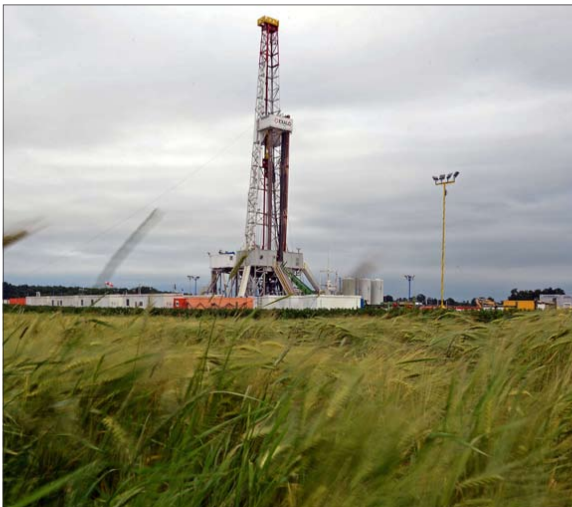
حفار نفطي تابع لشركة شيفرون الأميركية يستكشف الغاز الصخري في جنوب شرق بولندا

وجاء انخفاض برنت على الرغم من إعلان متحدث باسم المؤسسة الوطنية للنفط في ليبيا إن مسلحين اقتحموا حقل المبروك النفطي في وسط البلاد الذي تديره شركة توتال الفرنسية. إلى ذلك أظهرت بيانات من معهد البترول الأميركي أن مخزونات النفط الخام التجارية في الولايات المتحدة سجلت زيادة أكبر من المتوقع الأسبوع الماضي كما ارتفعت مخزونات البنزين المشتقات. وقال المعهد في تقريره الأسبوعي إن مخزونات الخام زادت بمقدار 6,1 ملايين برميل في الأسبوع المنتهي في 30 يناير لتصل إلى 412 مليون برميل في حين كانت توقعات المحللين تشير إلى زيادة قدرها 3,5 ملايين برميل.