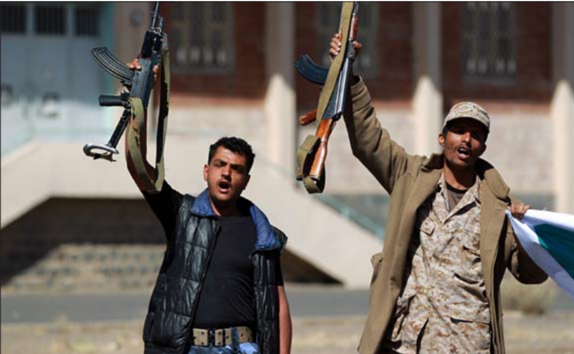
مسلحان حوثيان يلوحان بسلحيهما خلال تظاهرة في العاصمة صنعاء أمس

عملية انتقالية، مشيرا إلى ان سفراء الدول الداعمة يؤيدون المفاوضات الجارية بين الاطراف اليمنية تحت إشراف المبعوث الأممي جمال بن عمر، مشددا على «ضرورة تحقيق توافق سياسي عبر إرادة سياسية صادقة من جميع الأطراف اليمنية».