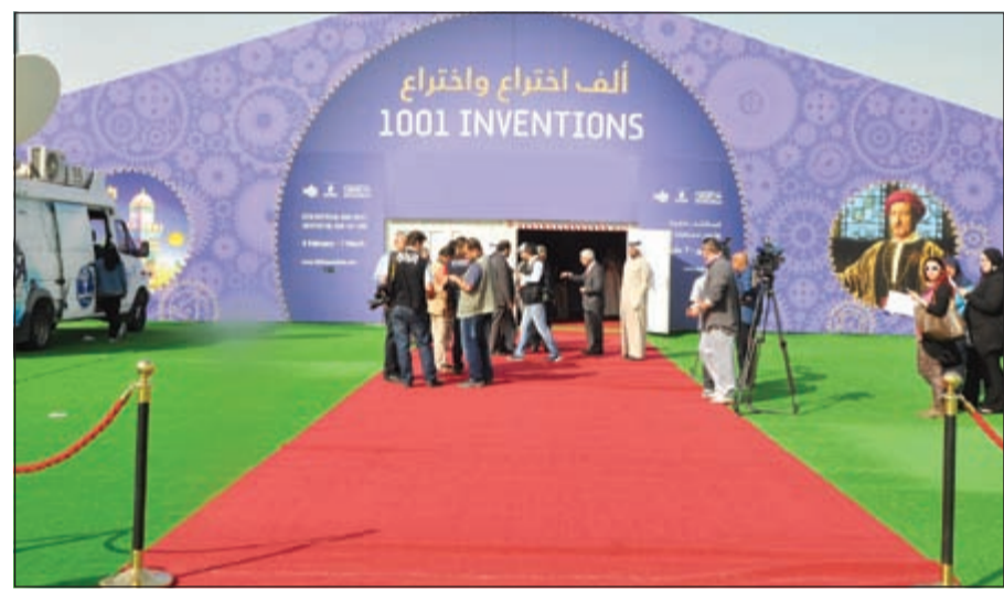
خيمة معرض ألف اختراع واختراع في المركز العلمي