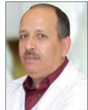
الفحص المبكر هو الحل لسرطان عنق الرحم

واضحة، حتى يتحول فيروس الورم الحليمي البشري (HPV) إلى خلايا سرطانية والتي تبدأ بدورها في الانتشار في باقي أنحاء الجسم. لذا، بات الكشف المبكر عن الفيروس أمرا بالغ الأهمية وذلك بهدف التخلص تماما من هذا المرض والحد من انتشاره في الكويت». تستهدف الحملة الوصول إلى السيدات من الفئة العمرية بين 35 إلى 55 عاما، إلا أنها تؤكد أن إمكانية الإصابة بسرطان عنق الرحم تبدأ من عمر الـ25 عاما. يذكر أن سرطان عنق الرحم يصيب الجهاز التناسلي للسيدات والذي يصل بين الرحم والمهبل. وتأتي الإصابة بسرطان عنق الرحم بنسبة 99% من الحالات بسبب إصابته بفيروس الورم الحليمي البشري (HPV)، كما أن معظم السيدات لا يشعرن بأعراض فيروس (HPV) وذلك لأن جهازهن المناعي يمنع الشعور بهذه الأعراض. وفي كثير من الأحيان تتطور الإصابة بهذا الفيروس حيث تتغير خلايا عنق الرحم، لتتحول إلى خلايا سرطانية، ويساهم الكشف الدوري على عنق الرحم في الاكتشاف المبكر لهذه الخلايا السرطانية قبل تطورها بعدة سنوات ومن ثم يصبح من السهل علاجها والحد من انتشارها.