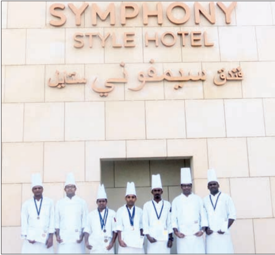
الفائزون بجوائز «هورিকা الكويت»