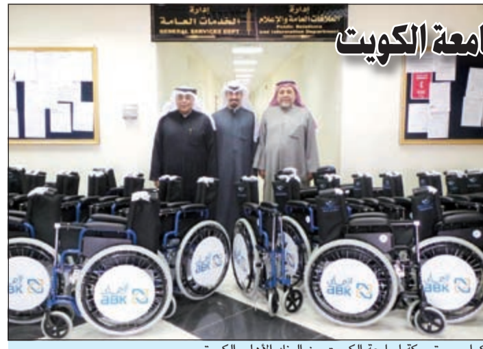
كراسي متحركة لجامعة الكويت من البنك الأهلي الكويتي