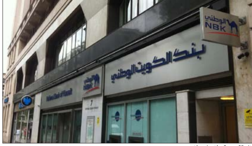
بنك الكويت الوطني فرع لندن