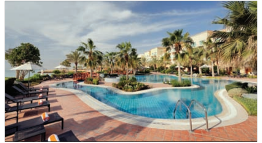
موفنيك - البدع

خطوات والتدابير الأخرى في هذا المجال داخل الفندق وخارجها، كالزيادة من المساحات الخضراء بالفندق، المساهمة في حملات التنظيف والتوعية والعديد غيرها. وأضاف ماجسد: «أن الشهادة تشكل دافعا وحافزا للفندق لاستمرار يمثل هذه المبادرات للمساهمة وبفاعلية في نشر الوعي عن مدى أهمية المحافظة على البيئة وكذلك في التنمية الاجتماعية والاقتصادية في الكويت».