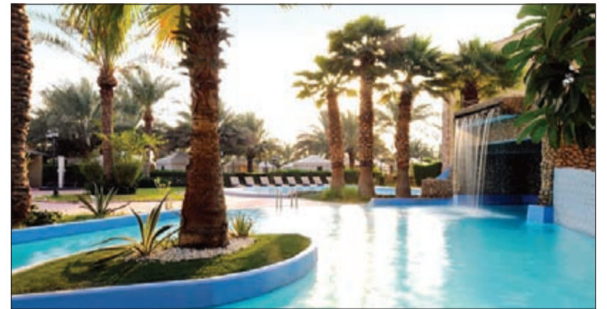
مسبح موفنيك المنطقة الحرة