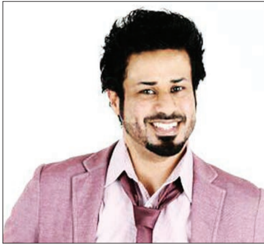
المطرب علي سالم