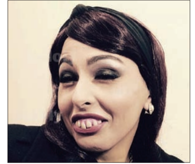
ميس حمدان في لوك صادم

صدمت الفنانة الأردنية ميس حمدان، متابعيها على حسابها الخاص على موقع «انستغرام»، بصورة لها ظهرت فيها بشكل قبيح جداً. وظهرت الفنانة الأردنية في