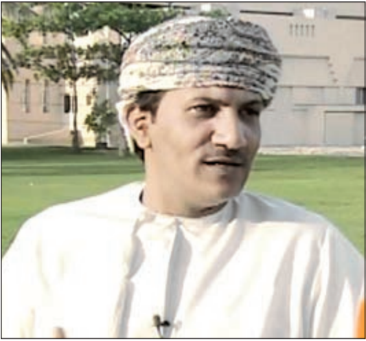
الشاعر الغنائي العماني طارش قطن