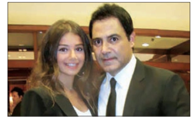
عاصي وابنته ماريثا

احتفل الفنان عاصي الحلاني، بعيد ميلاد ابنته الكبرى ماريثا، التي بلغت الـ 18 ربيعاً، وتوجه إليها بكلمات مؤثرة من القلب.