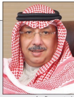
الشيخ محمد الجراح

الدولي' يوصي بتوزيع 9% نقدًا وأرباحه تسجل 13.7 مليون دينار بـ 2014