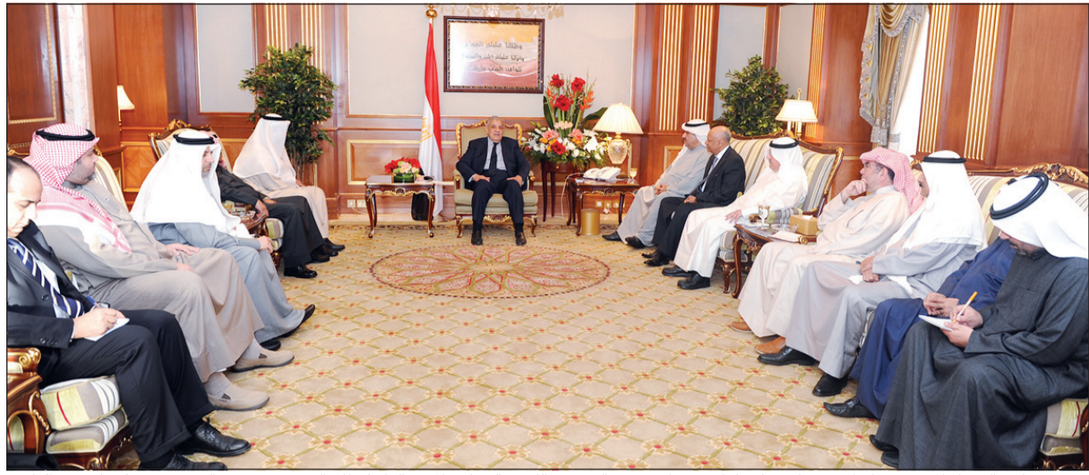
رئيس مجلس الوزراء المصري م. إبراهيم محلب خلال لقائه رؤساء تحرير الصحف الكويتية ونائب المدير العام لقطاع التحرير ورئيس التحرير في "كونا" سعد العلي

كونا: أشاد رئيس مجلس الوزراء المصري م. إبراهيم محلب بالعلاقات المتينة التي تربط بين بلاده والكويت في كل المجالات، ممنمًا الدعم الذي قدمته الكويت لمصر وحرص قيادتها الحكيمة على الوقوف معها سعيًا إلى تحقيق الأمن والاستقرار المنشودين في المنطقة. ونوه محلب خلال لقائه رؤساء تحرير الصحف الكويتية ونائب المدير العام لقطاع التحرير ورئيس التحرير في وكالة الأنباء الكويتية (كونا) سعد العلي على هامش زيارته الرسمية للبلاد -أشاد بنتائج اللقاءات والاجتماعات التي عقدها خلال اليومين الماضيين مع جميع المسؤولين وفي مقدمتهم صاحب السمو الأمير الشيخ صباح الأحمد.