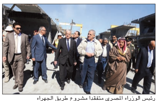
رئيس الوزراء المصري متفقد مشروع طريق الجبراء