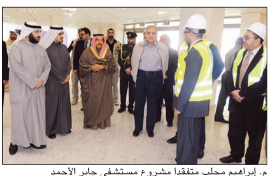
م. إبراهيم محلب متفقد مشروع مستشفى جابر الأحم

الخارجية وسكن الطاقم الطبي ومركز الإسعافات. وأضاف محسن أنه تم الانتهاء من 76% من تنفيذ المستشفى وسيتم الانتهاء منه خلال شهر ديسمبر المقبل بتكلفة تقدر بـ 304 ملايين دينار. وكان رئيس مجلس الوزراء المصري قد بدأ زيارة رسمية للكويت أول من أمس تستمر ثلاثة أيام تلبية لدعوة من سمو رئيس مجلس الوزراء الشيخ جابر المبارك.