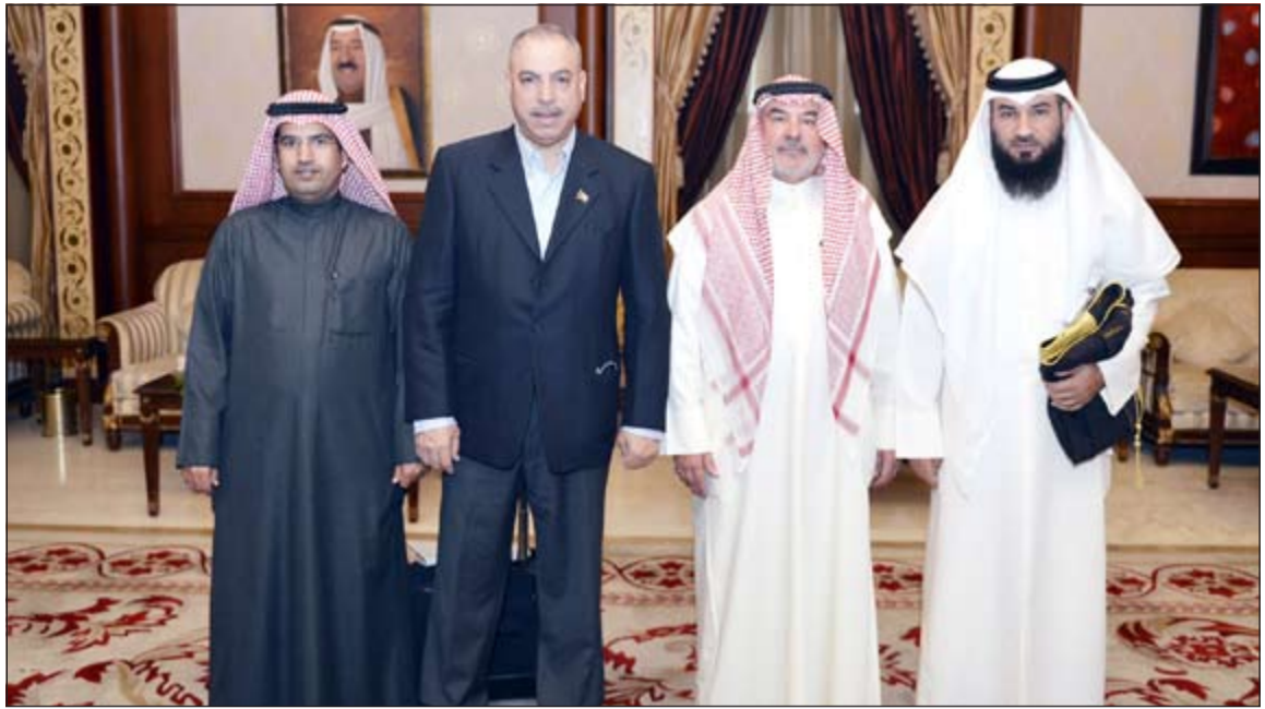
صالح عاشور وفصيل الشايح وسيف العازمي والأمين العام غلام الكندري أثناء مغادرتهم إلى السودان

غادر البلاد صباح اليوم وفد الشعبة البرلمانية الكويتية برئاسة وكيل الشعبة النائب فيصل الشايح متوجها إلى العاصمة السودانية الخرطوم للمشاركة في اجتماع اللجنة التنفيذية للاتحاد البرلماني العربي وذلك خلال الفترة من 3 إلى 5 فبراير الجاري. ويضم الوفد كلا من أمين صندوق الشعبة النائب صالح عاشور وعضو الشعبة النائب سيف العازمي وأمين عام مجلس الأمة غلام الكندري. ومن المقرر أن يشارك وفد الشعبة البرلمانية الكويتية في اجتماعات اللجنة التنفيذية ولجنة جائزة التميز البرلماني العربي والتي سيحضرها أمين عام المجلس بصفته رئيسا لجمعية الأئمساء العاملين للبرلمانات العربية.