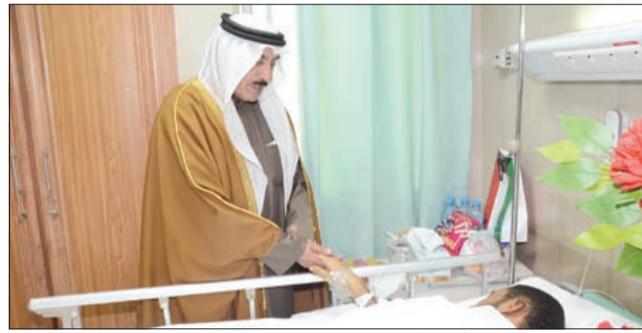
محافظ الجھراء مطمئناً على صحة مصاب آخر

قام محافظ الجھراء الفريق متقاعد فهد الأمير بزيارة إلى البحرينيين المصابين في حادث طريق العبدلي للاطمئنان على صحتهم، وطلب المحافظ من إدارة مستشفى الجھراء تسخير كافة الإمكانيات لعلاج المصابين وتسجيل عودتهم لدولة البحرين الشقيقة بأسرع وقت ممكن. وفي نهاية الزيارة شكر فهد الأمير كافة الطاقم الطبي المشرف على المصابين، متمنياً لهم الشفاء العاجل.