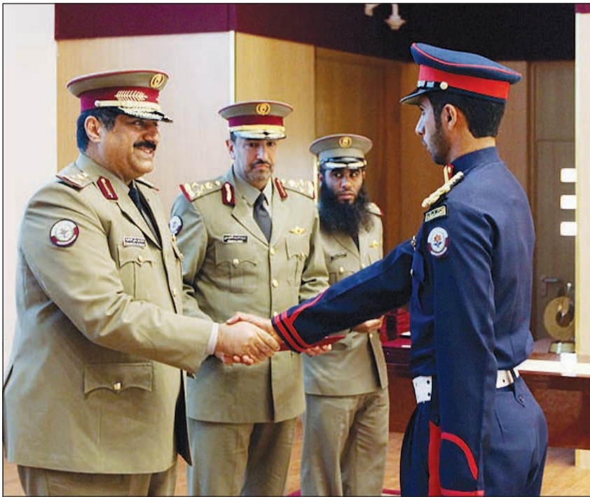
تكريم أحد الخريجين

احتفت قيادة التعليم العسكري في الحرس الوطني، بالضباط خريجي كلية أحمد بن محمد العسكرية في دولة قطر الشقيقة الذين تم تأهيلهم في عدد من التخصصات المهمة ضمن سياسة التعاون والبناء وتبادل الخبرات بين الأجهزة الأمنية في دول مجلس التعاون لدول الخليج العربية.