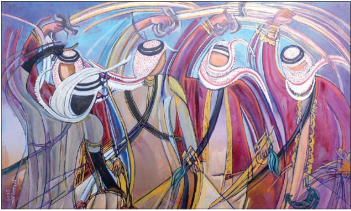
إحدى اللوحات المعروضة