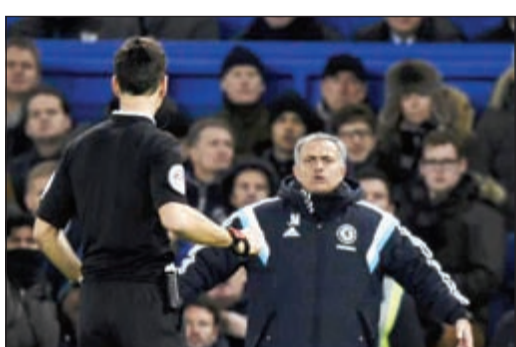
الداهية مورينيو يفعل أزمة جديدة

رفض المدرب البرتغالي جوزيه مورينيو المدير الفني لفريق تشلسي حضور المؤتمر الصحافي عقب مباراة مان سيتي في قمة مباريات الجولة 23 من «البريمير ليغ». وذكرت صحيفة «ميرور» البريطانية أن رابطة الدوري الإنجليزي أرسلت خطابا رسميا لنادي تشلسي للاستفسار عن سبب عدم حضور مورينيو للمؤتمر، وكذلك إقامة المؤتمر الذي كان من المفترض عقده للحدث في قمة السبتي. وأشارت الصحيفة إلى أن المدرب البرتغالي لجأ لهذا الإجراء، ردا منه على العقوبة التي نالها بتغريمه 25 ألف جنيه إسترليني، بسبب تصريحاته التي قال فيها إن البلوز يتعرض لحملة ممنهجة من التحكيم لعرقلة مشواره نحو التتويج بالدوري الإنجليزي هذا الموسم.